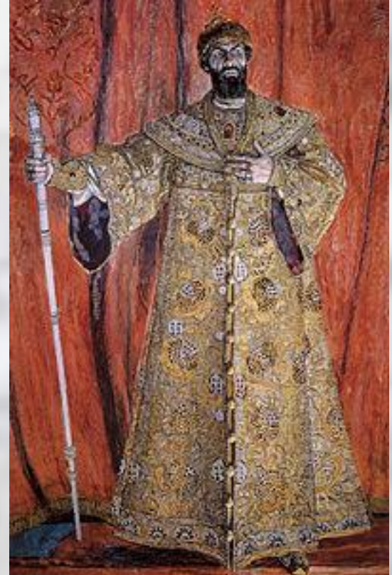
Ф. Шаляпин в роли Бориса Годунова

Известность М. принесла опера «Борис Годунов», поставленная на сцене Мариинского театра в СПб. в 1874 г. и сразу же признанная выдающимся произведением.