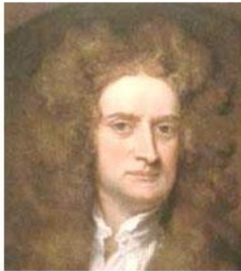
Исаак Ньютон (1642-1727)

В Англии жил великий ученый Ньютон. Однажды осенью гуляя по саду он увидел как с ветки упало яблоко. Он первым понял, что яблоко притянула Земля. Так был открыт закон всемирного тяготения.