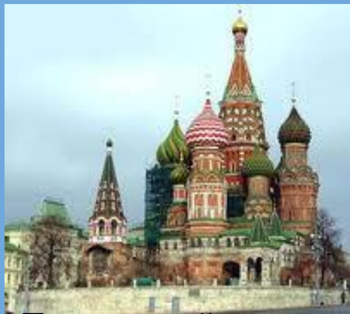
Покровский собор в Москве