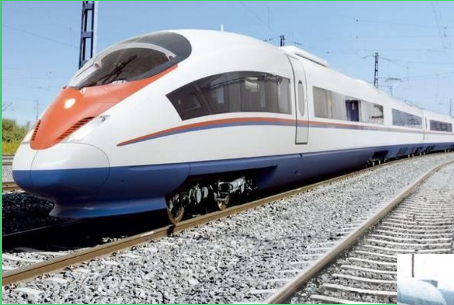
Поезд дальнего следования