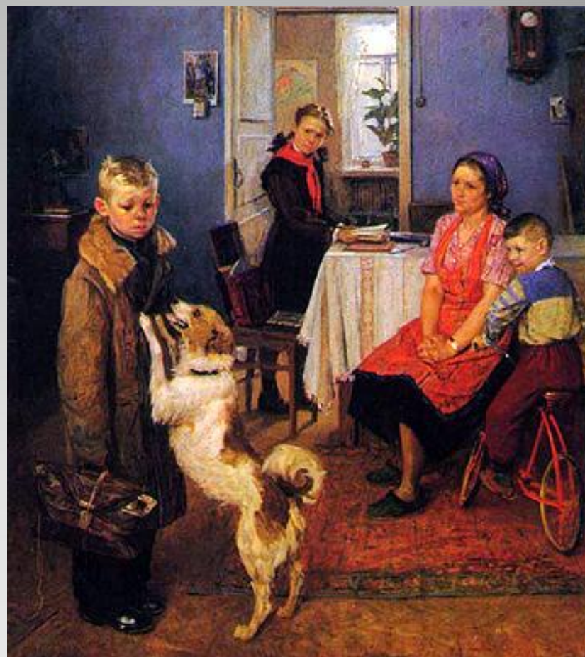
Ф. Решетников «Опять двойка»

Дети несут ответственность за то, как они учатся.