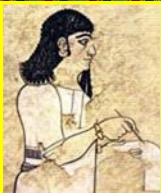
Ахикар Писец ассирийского царя Синахериба VIII - VII вв. до н.э.