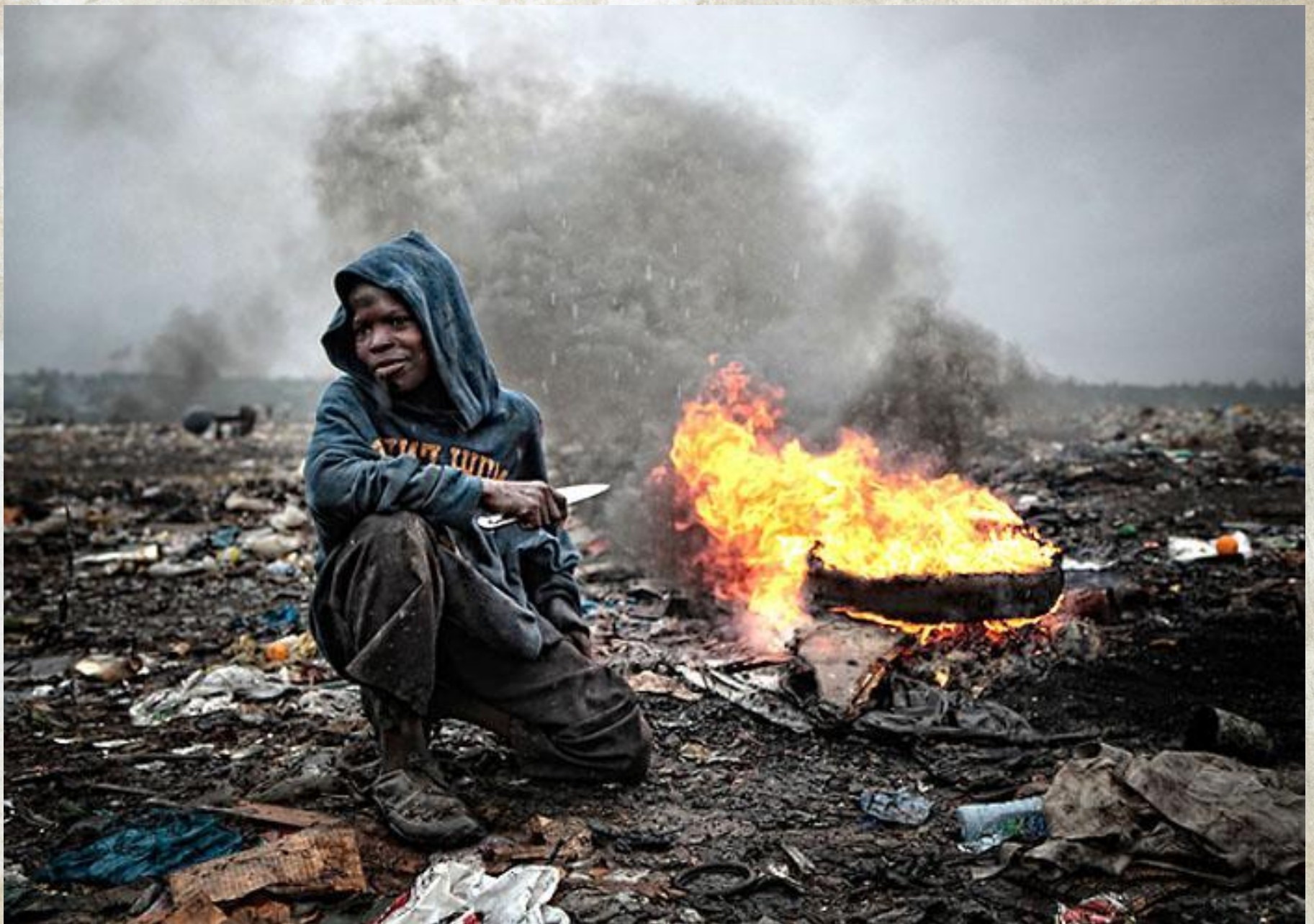
Свалка мусора Hulene в Мапуту, выживание людей в нечеловеческих условиях.