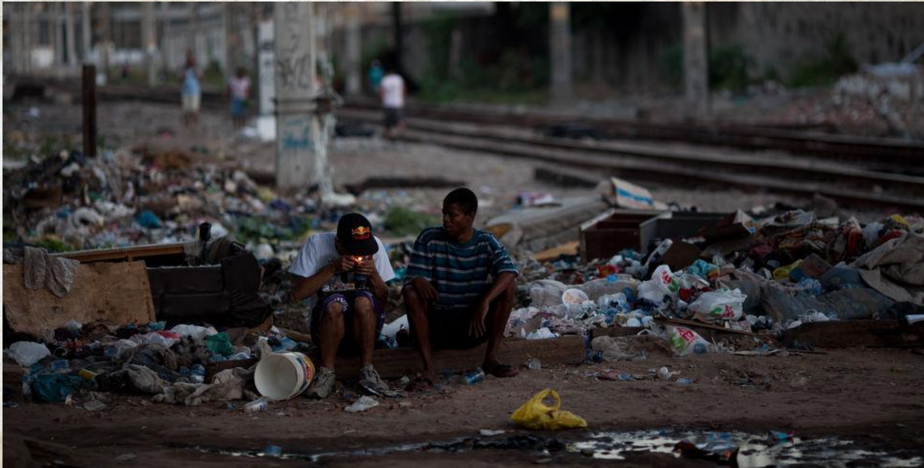
Вблизи трущоб Мангиньос. Рио-де-Жанейро.