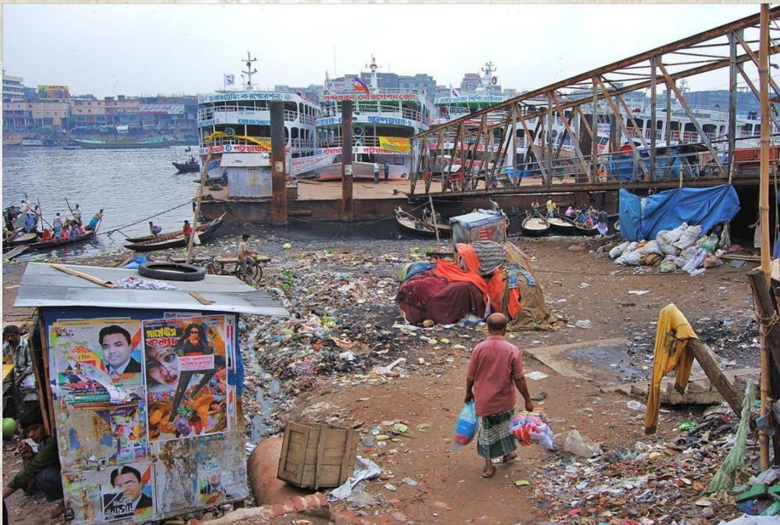
Бангладеш. Столица Дакка.

А в бедных странах пока не нашли решение для этой проблемы. Поэтому людям приходится выживать в этих условиях и приспособляться к ним.