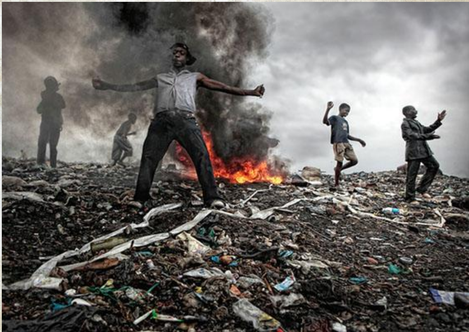
Молодежь проводит все свое свободное время на свалке мусора.