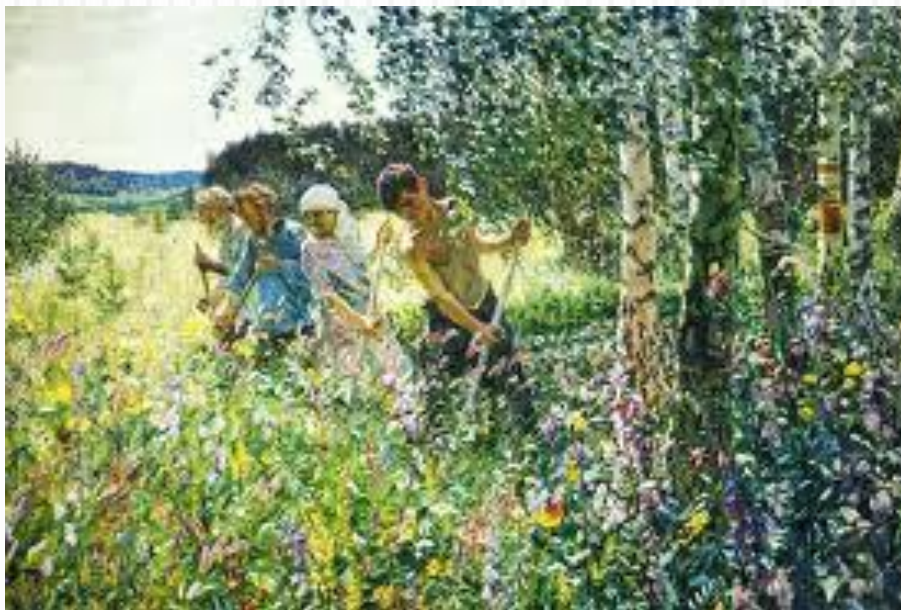
А.А. Пластов «Сенокос»