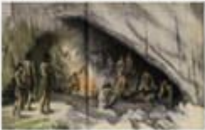
Неандертальцы – жизнь в пещере