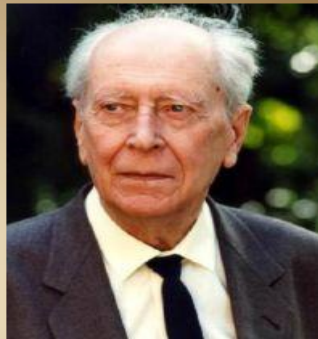
Дмитрий Сергеевич Лихачев

«Любовь к своей стране и своему народу – это и есть начало, которое по-настоящему освящает всю деятельность человека, приносит ему настоящее счастье, избавляет от неприятностей, мелких личных неудач».