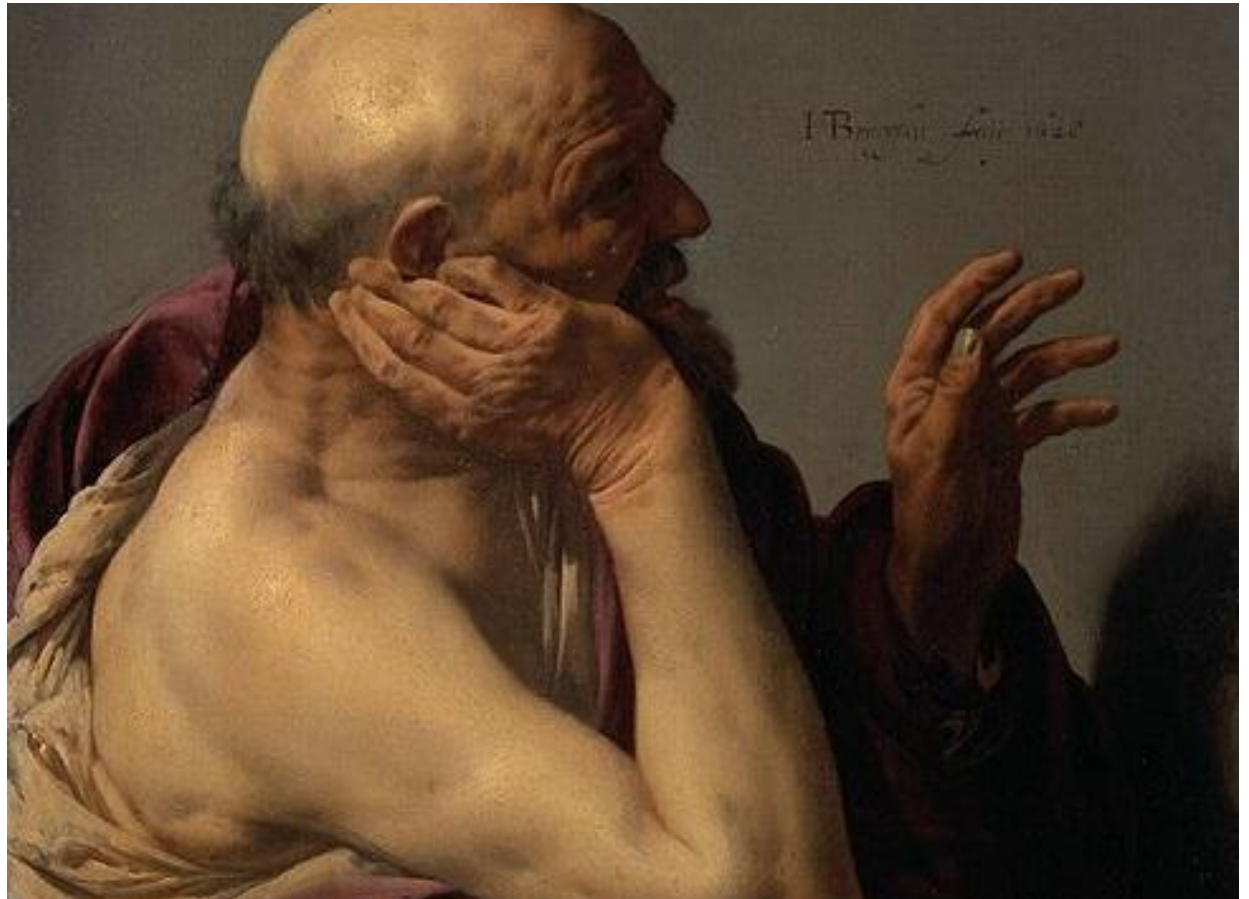
Хендрик Тербрюгген. Гераклит Эфесский, 1628

Коренной житель Эфеса, он принадлежал к древнему аристократическому роду, восходящему к основателю Эфеса Андроклу. Благодаря происхождению обладал рядом «царских» привилегий и потомственным жреческим саном при храме Артемиды Эфесской. Однако в то время власть в Эфесе уже не принадлежала аристократам.