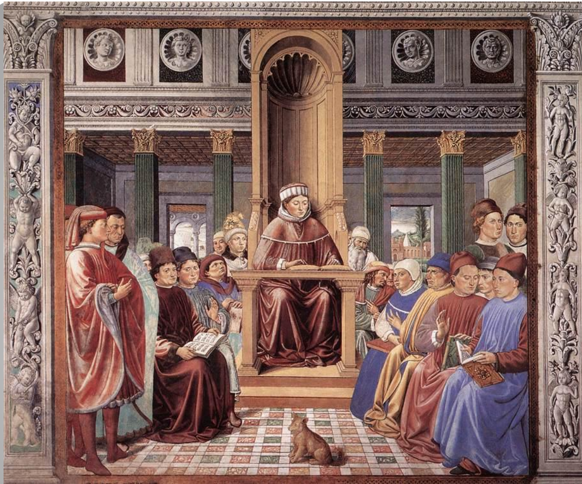
Бенотцо Гоццоли. Св. Августин учит в Риме. 1464—1465 гг.

Его наследие по теологии и критике поистине огромно. Наиболее известен автобиографический труд «Исповедь», положивший начало исповедальному жанру. Августин назван католическими богословами «блаженным». Как богослов и писатель имел сильное влияние на оформление всей догматики католицизма. Наиболее известные произведения: «О христианской доктрине», «О граде Божием». Учение Августина стало неопровержимым авторитетом в эпоху средневековья.