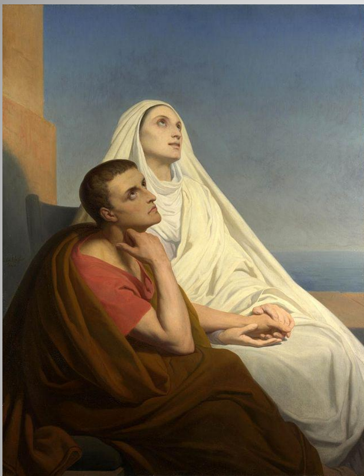
Святой Августин и Святая Моника