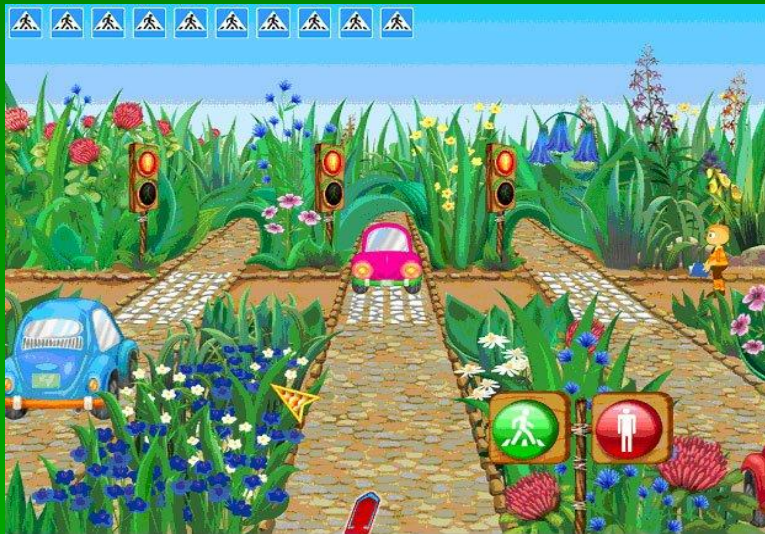
Рис.3 Пример игры-симулятора «Правила дорожного движения»

4) Ролевые Цель героев – исследовать виртуальный мир и выполнить поставленную в начале игры задачу. Задачей может быть отыскание определённого клада.