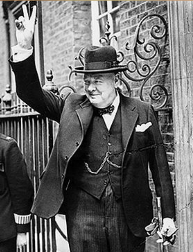
Уинстон Черчилль Winston Churchill