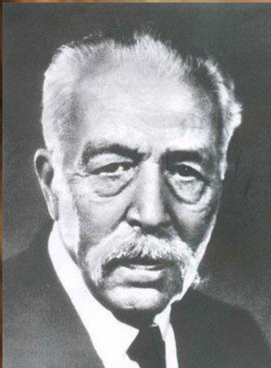
Гаэтано Моска (1858 -1941), итальянский юрист, социолог