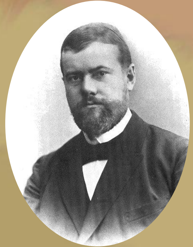
Макс ВЕБЕР (1864 – 1920) немецкий философ и социолог.