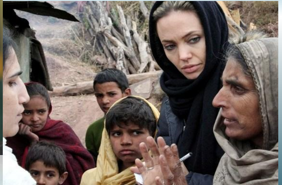
Анджелина Джоли, (США)