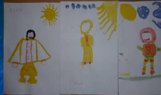
Рисование орнамента на одежде