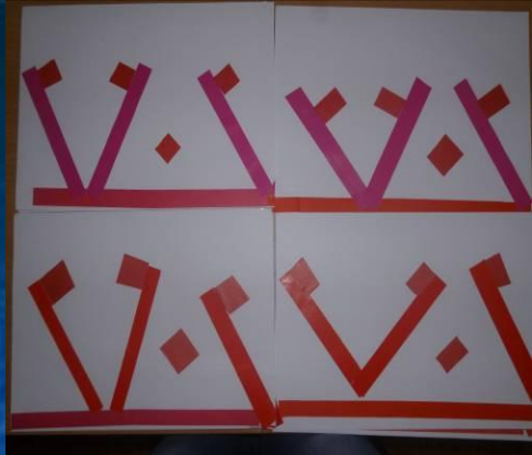
Орнамент «Заячы уши»