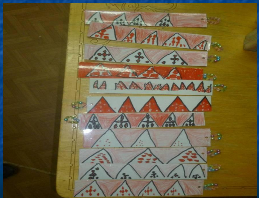
Закладка для книги Орнамент «Чум»