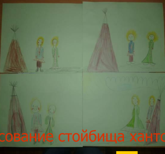
«Рисование стойбища хантов»