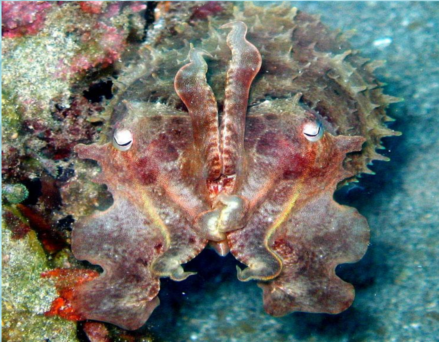
Превосходный небольшой кальмар