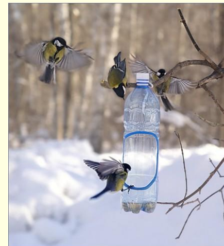
Бутылка - кормушка