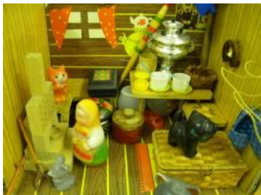
Быт и традиции русского народа