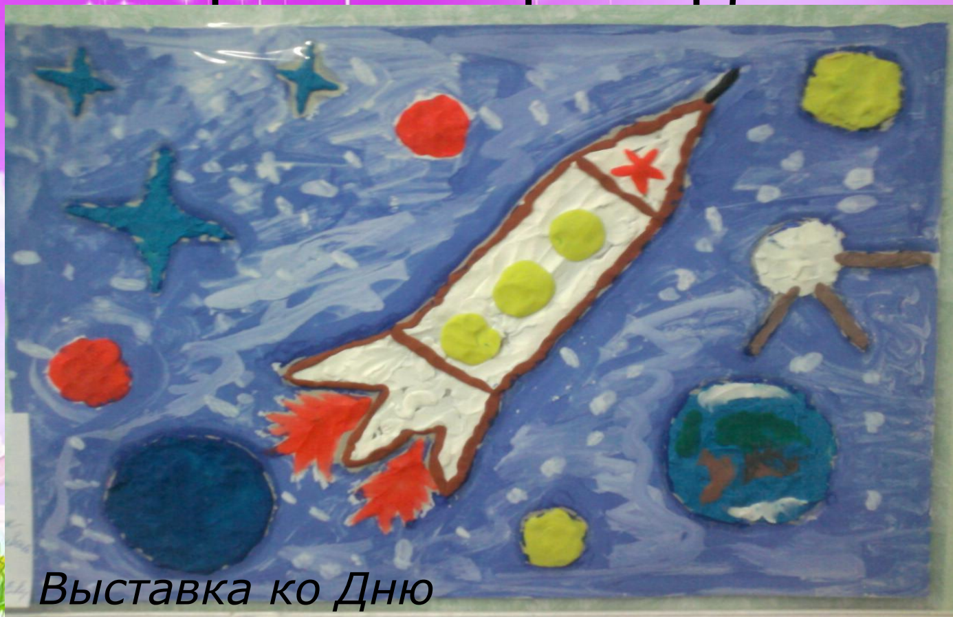
Выставка ко Дню Космонавтики