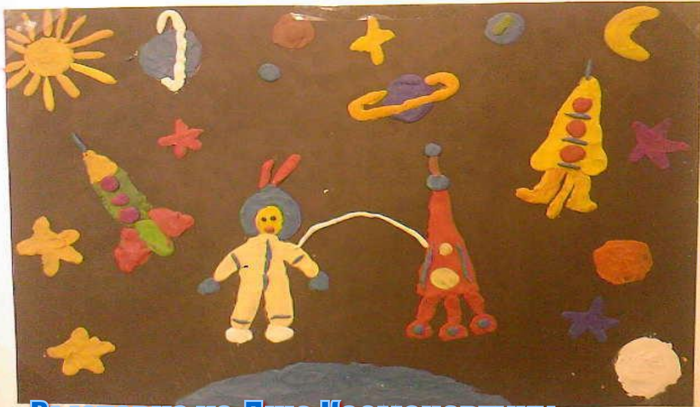
Выставка ко Дню Космонавтики (метод плоской лепки)