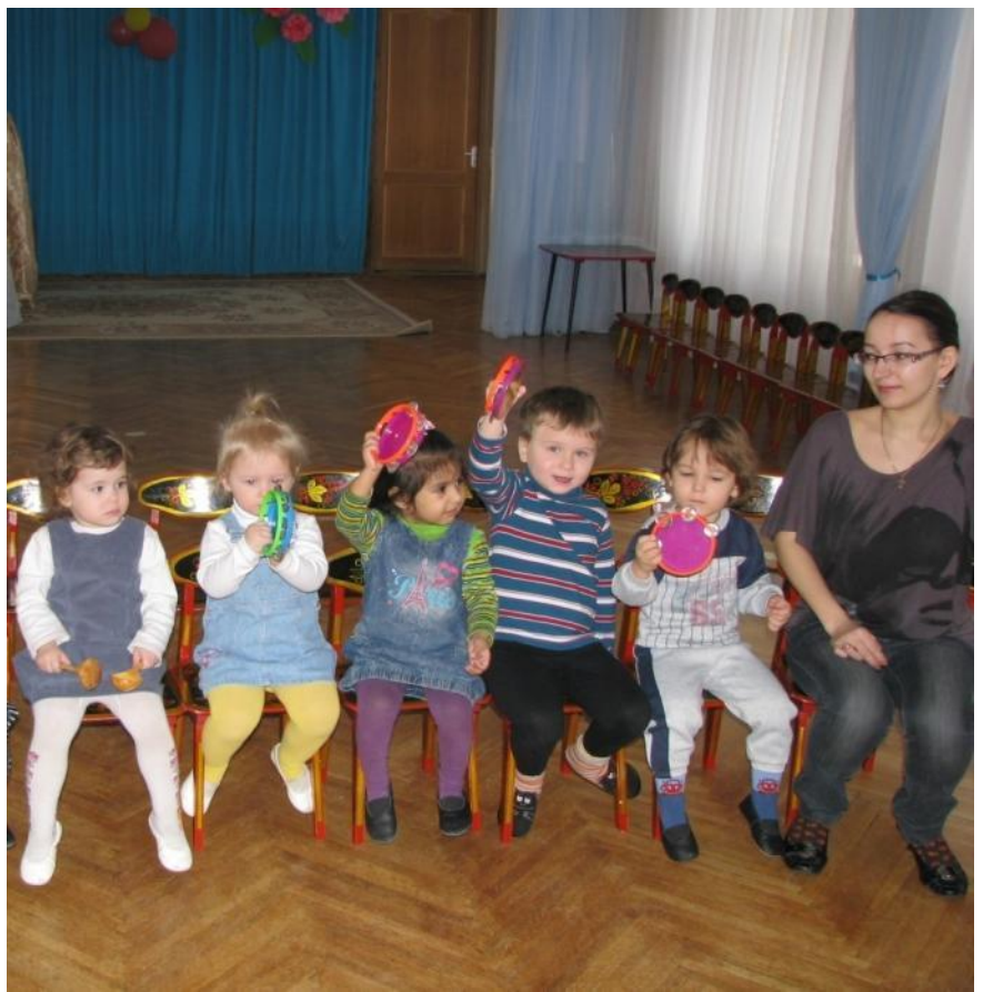
На дне рождения у куклы Маши звучит оркестр.