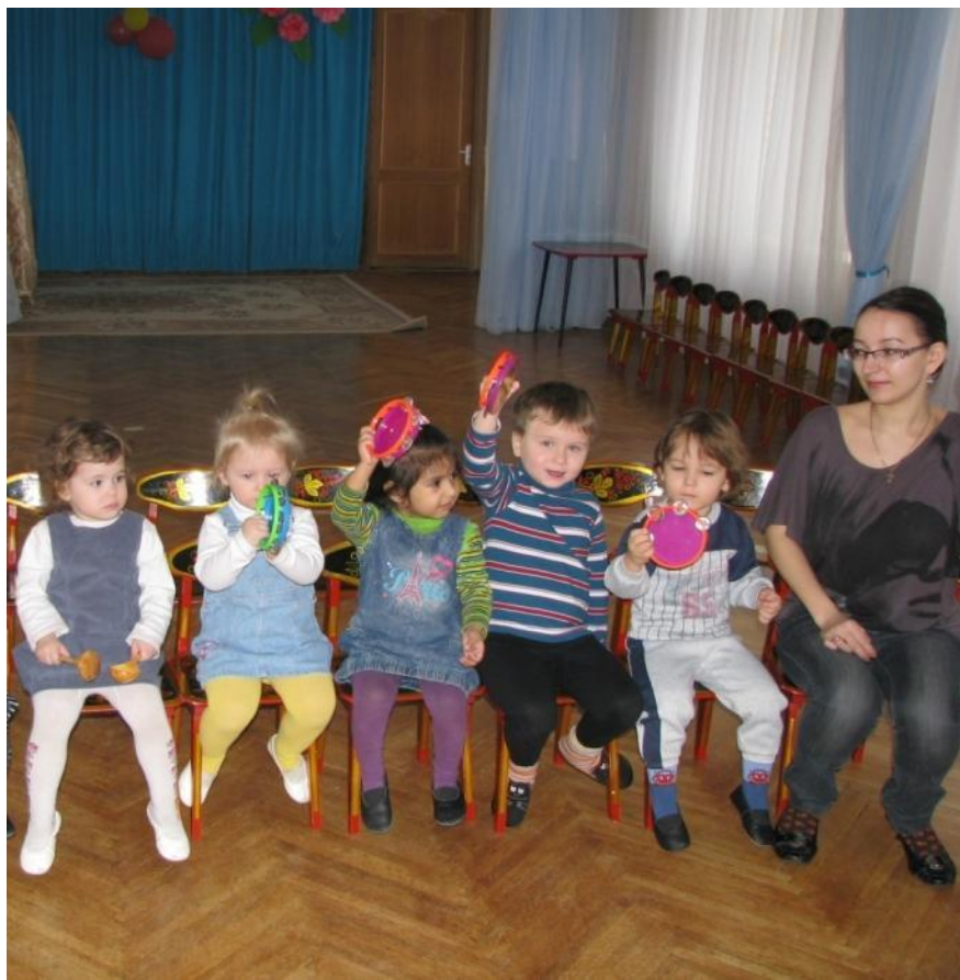
На дне рождения у куклы Маши звучит оркестр.