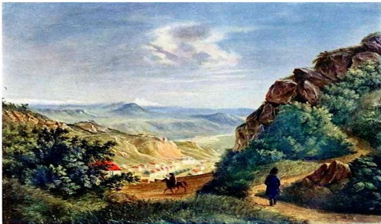
М. Ю. Лермонтов, «Вид Пятигорска» 1837 г., картон, масло. Государственный литературный музей