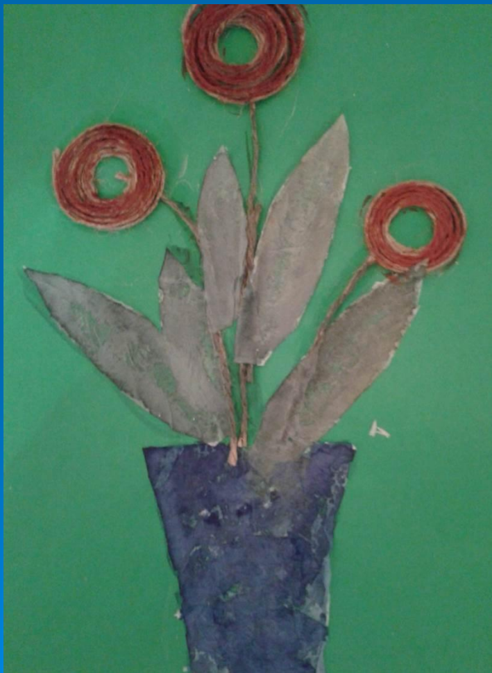
«Розы в вазе»

«Ниткопись» – рисование при помощи ниток. Выкладывание ниток по контуру какого – либо изображения