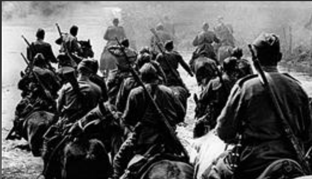
Кавалеристы в боях под Москвой