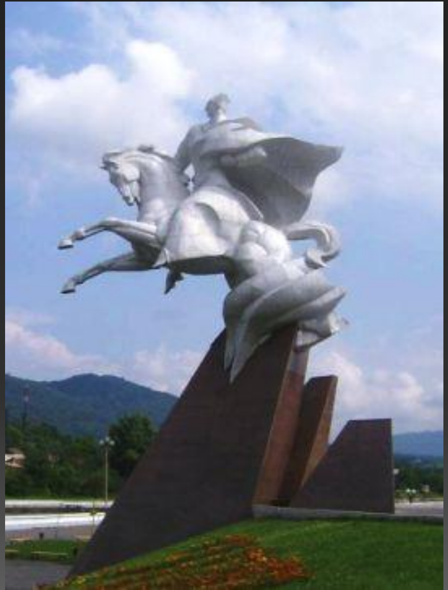
Памятник Плиеву И. А., Владикавказ , Северная Осетия