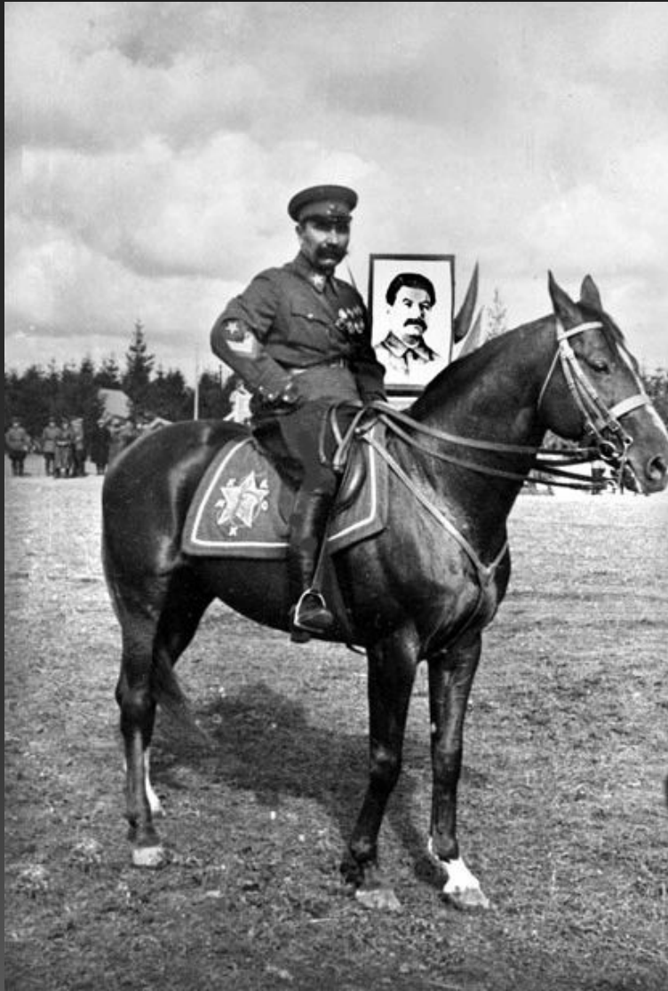
С.М.Буденный в боях под Москвой

По требованиям Будённого советское командование летом 1941 приступило к формированию новых кавалерийских дивизий. Во время Великой Отечественной войны входил в состав Ставки Верховного Главнокомандования, участвовал в обороне Москвы, командовал группой войск армий резерва Ставки, затем — главком войск Юго-Западного направления, командующий Резервным фронтом, главком войск Северо-Кавказского направления, командующий Северо-Кавказским фронтом.