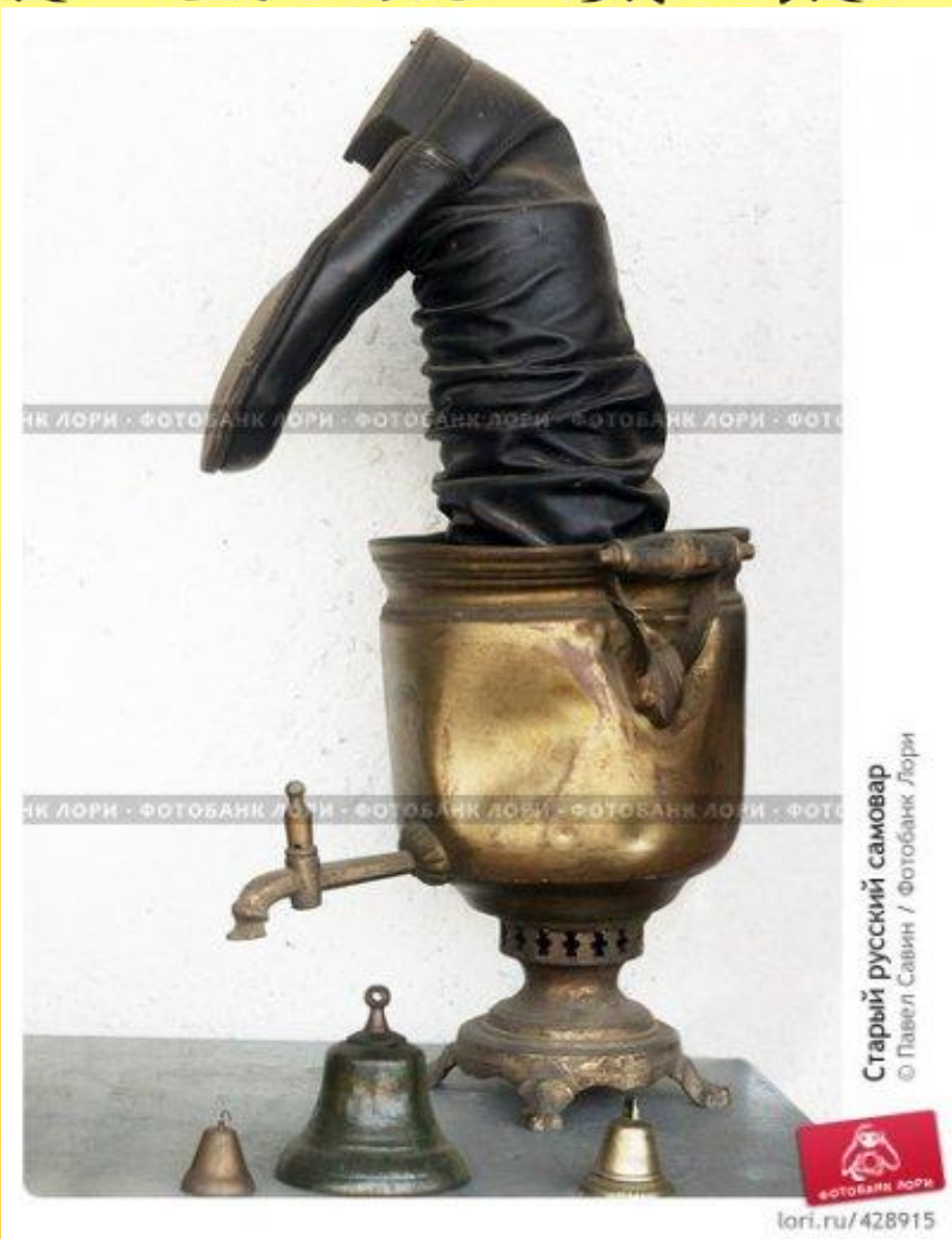
Старый русский самовар