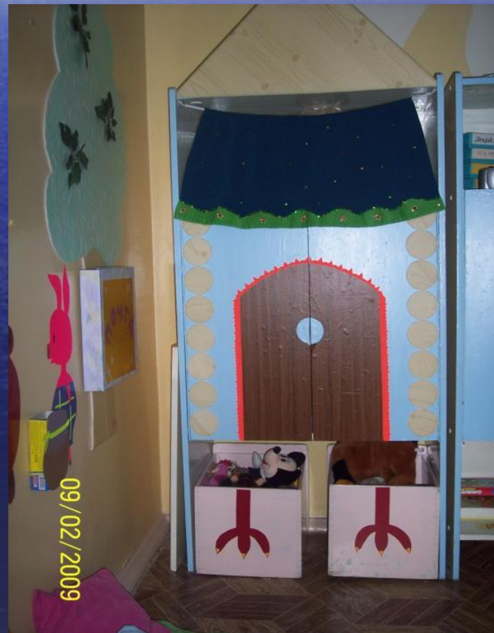
Избушка Трёх медведей