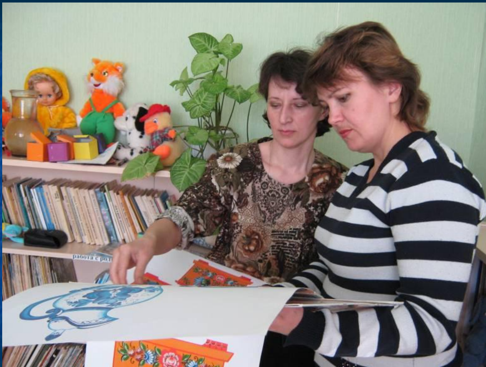
Работа по созданию проекта с молодыми специалистами