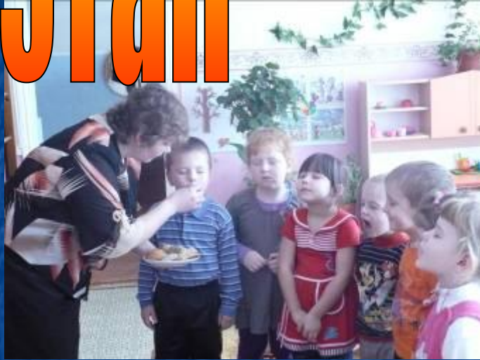
"Угадай на вкус"