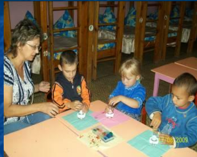
Изучаем свойства воды