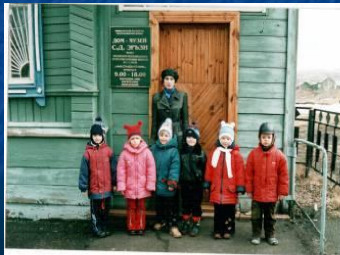
Экскурсия в дом-музей С.Д.Эрзы