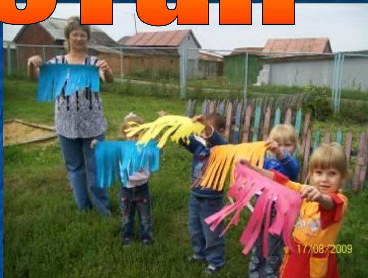
Откуда дует ветер?