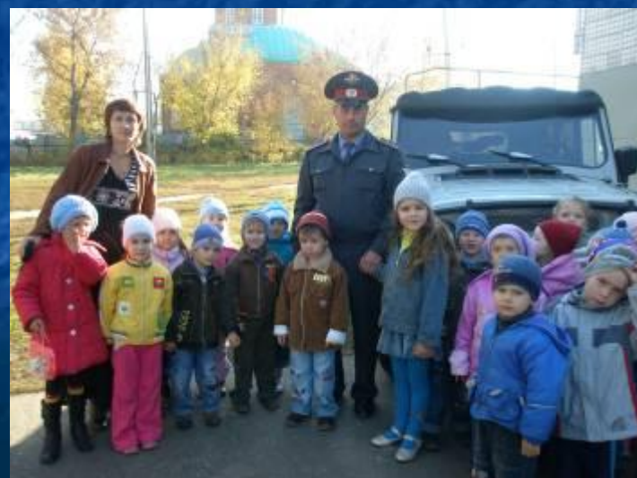
В гостях у ГАИ