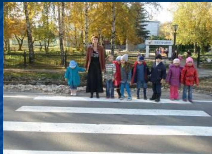
На пешеходном переходе