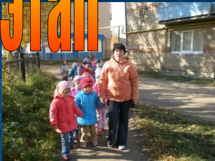
Знакомимся с улицами родного поселка