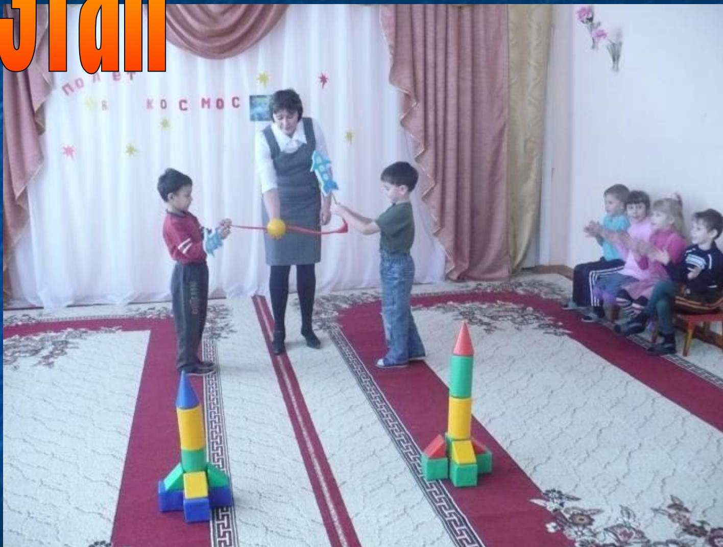
"Полет в Космос"