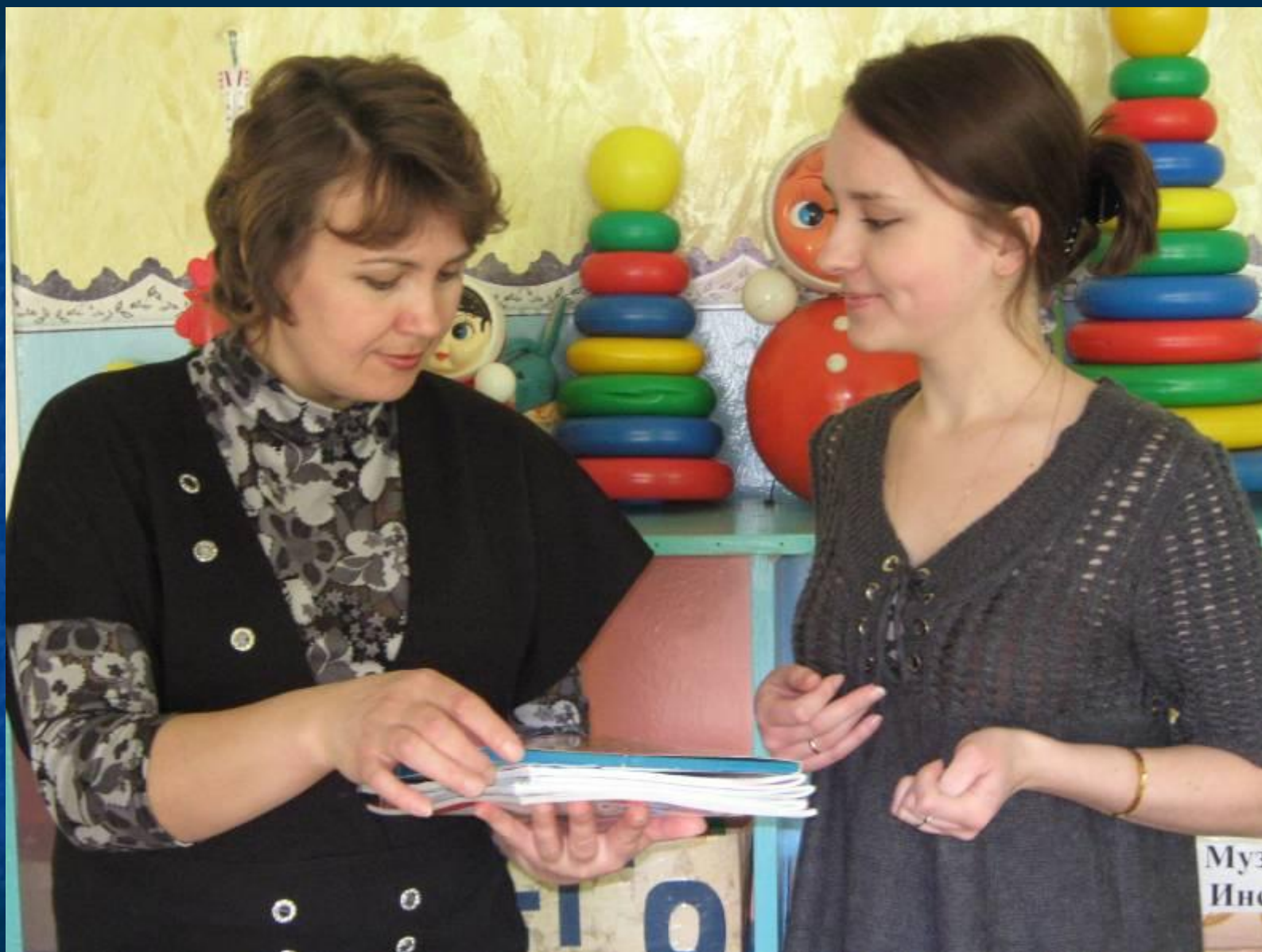
Изучение технологии проектирования