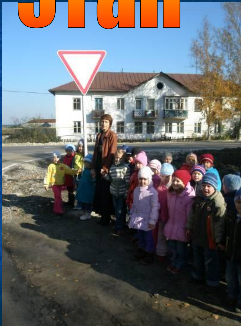
Изучаем дорожные знаки