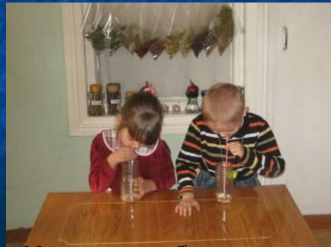
Измеряем объем легких