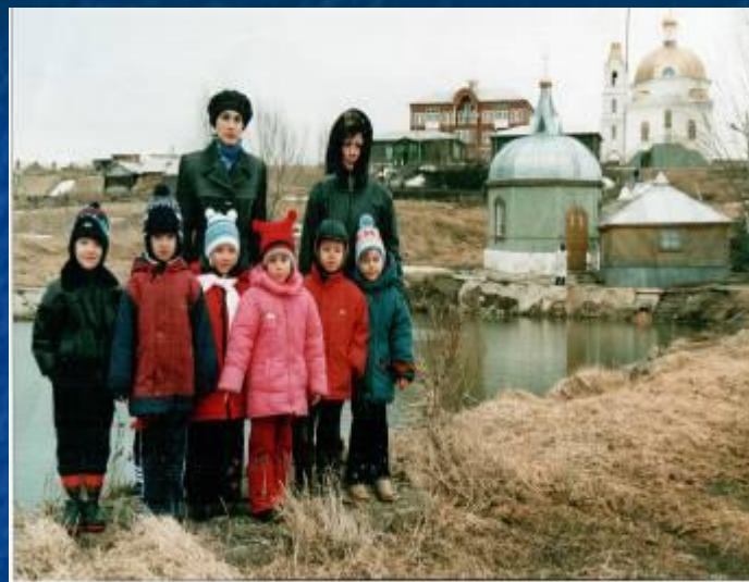
У святого источника