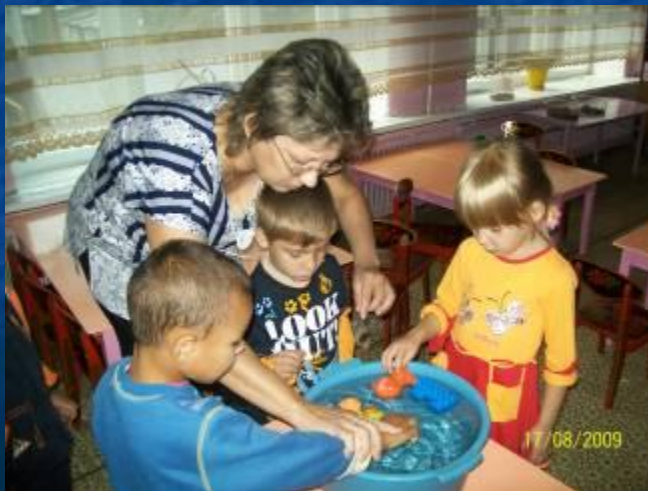
Тонет - не тонет