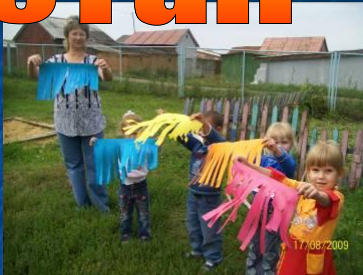
Откуда дует ветер?