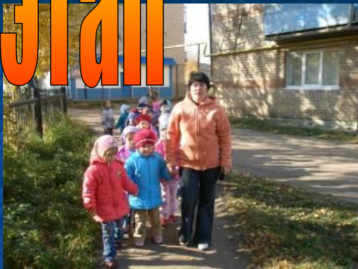
Знакомимся с улицами родного поселка