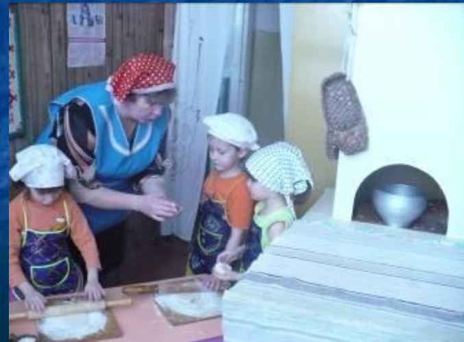
"Испечем мы пирожки"