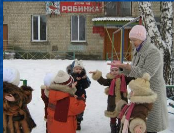
Изучаем свойства снега