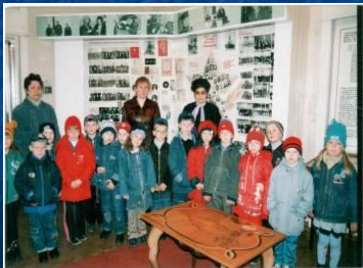
В музее трудовой славы светотехнического завода