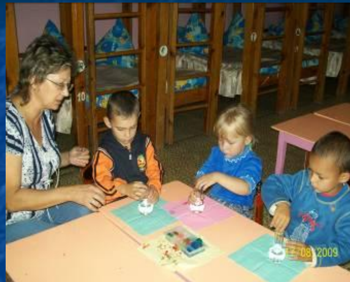
Изучаем свойства воды