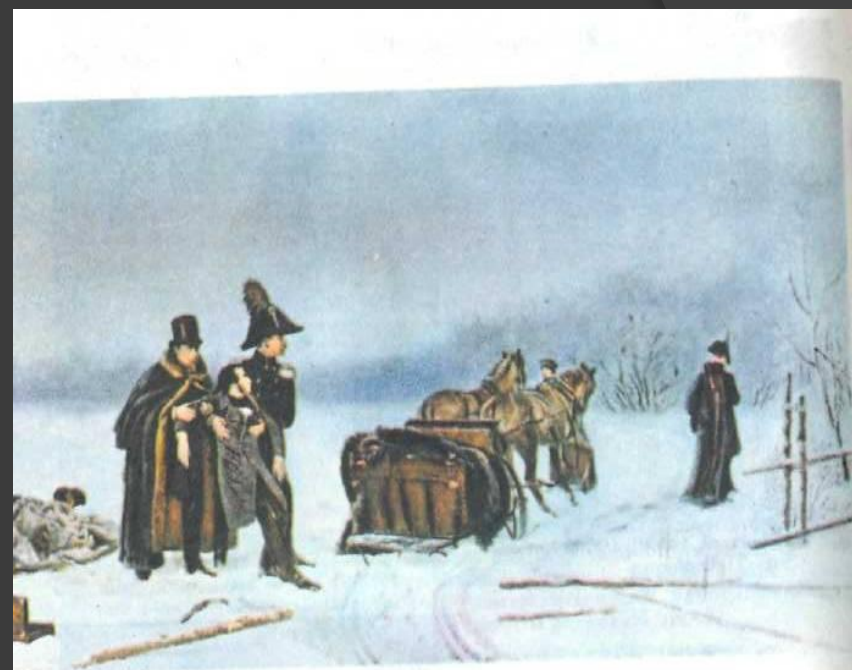
Дуэль Пушкина с Дантесом. Картина работы А. А. Наумова. 1885.

Короткий зимний день уже клонился к вечеру, когда Пушкин и его секундант К. К. Данзас отправились на Черную речку — недалекий пригород Петербурга, где была назначена дуэль.