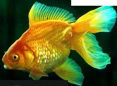
обыкновенная золотая рыбка