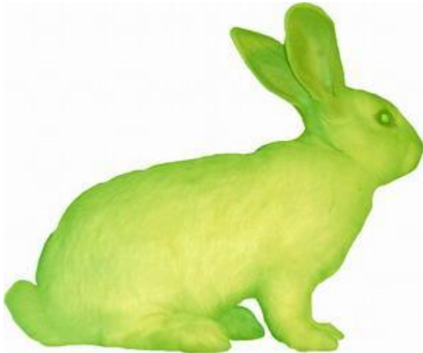
Флуоресцентный кролик, полученный методом генной инженерии

Это спорный вопрос. Сторонники ГМП утверждают, что генная инженерия спасет растущее население земли от голода