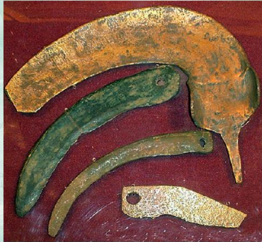
Бронзовые орудия труда. 1 тыс. лет до н.э.

Важнейший фактор эволюции человека - труд. Способность изготавливать орудия труда свойственна только человеку. Животные могут лишь использовать отдельные предметы для добывания пищи (например, обезьяна использует палку, чтобы достать лакомство). Трудовая деятельность способствовала закреплению морфологических и физиологических изменений у предков человека, которые называют антропоморфозами .