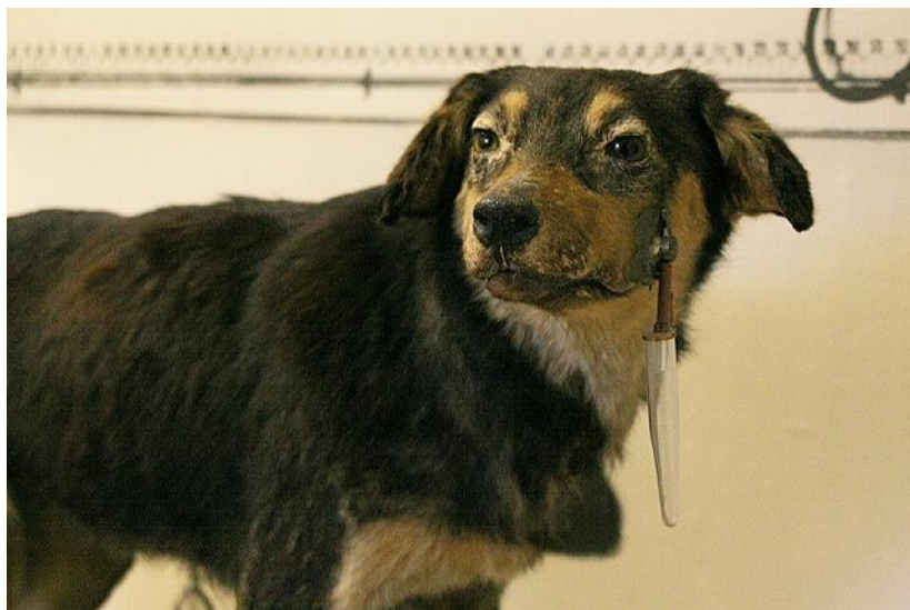
Собака Павлова, Музей Павлова, 2005

В Мадридском докладе, сделанном на русском языке, И. П. Павлов впервые сформулировал принципы физиологии высшей нервной деятельности, которой он и посвятил последующие 35 лет своей жизни. Такие понятия как подкрепление, безусловный и условный рефлекс, стали основными понятиями науки о поведении