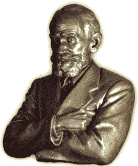
М.Г. Манизер Бюст И.П. Павлова, 1949 год

http://www.venda.ru/project/2007/Katsman/page1.htm