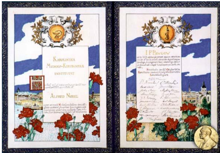
Диплом и золотая медаль лауреата Нобелевской премии 1904 года

В 1903 году 54-летний Павлов сделал доклад на XIV Международном Медицинском Конгрессе в Мадриде. И в следующем, 1904 году, Нобелевская премия за исследование функций главных пищеварительных желез была вручена И. П. Павлову, — он стал первым российским Нобелевским лауреатом