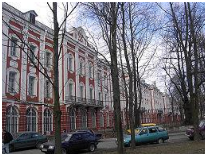
Главный фасад здания Двенадцати коллегий, выходящий на Менделеевскую линию. Современный вид

В 1870 поступил на юридический факультет (семинаристы были ограничены в выборе университетских специальностей), но через 17 дней после поступления перешёл на естественное отделение физико-математического факультета Петербургского университета (специализировался по физиологии)