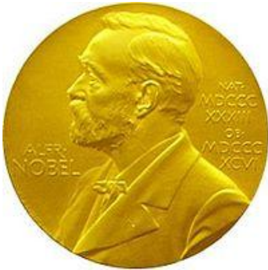
Медаль, вручаемая лауреату Нобелевской премии

В 1903 году 54-летний Павлов сделал доклад на XIV Международном Медицинском Конгрессе в Мадриде. И в следующем, 1904 году, Нобелевская премия за исследование функций главных пищеварительных желез была вручена И. П. Павлову, — он стал первым российским Нобелевским лауреатом