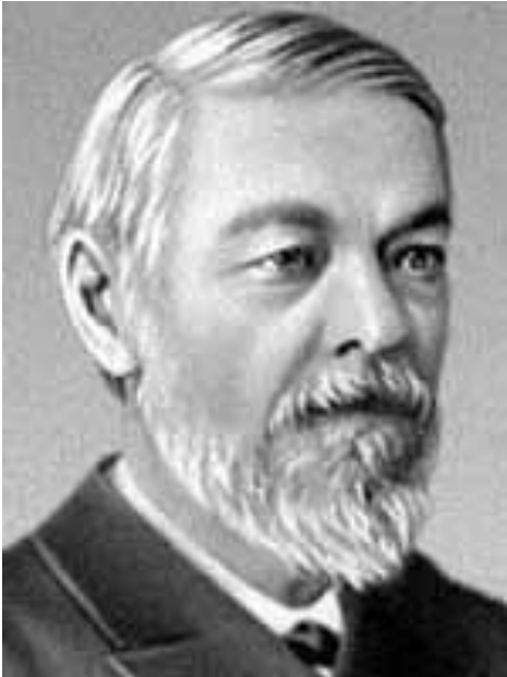
И. М. Сеченов