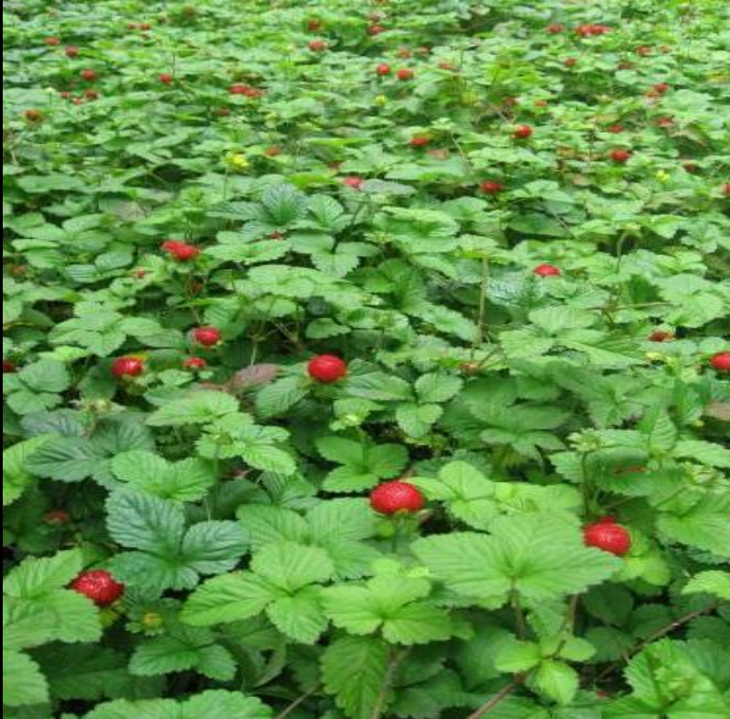
вид земляника лесная описан Карлом Линнеем

2. Описал около 8000 видов растений и 4000 видов животных, разработал первые критерии вида