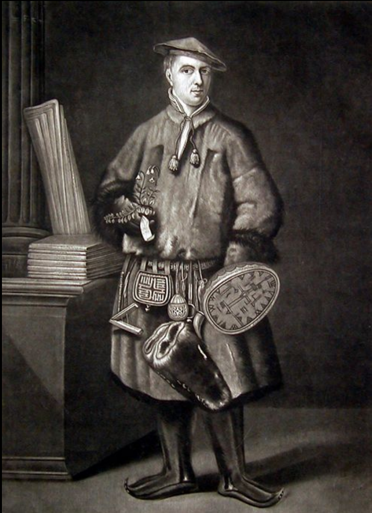
Линней в лапландском костюме 1737 год

1735 год – получена степень доктора медицины; смотритель коллекций и ботанического сада Амстердама (Голландия)