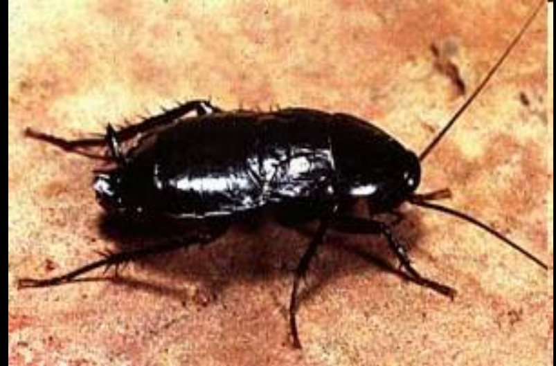
вид таракан чёрный