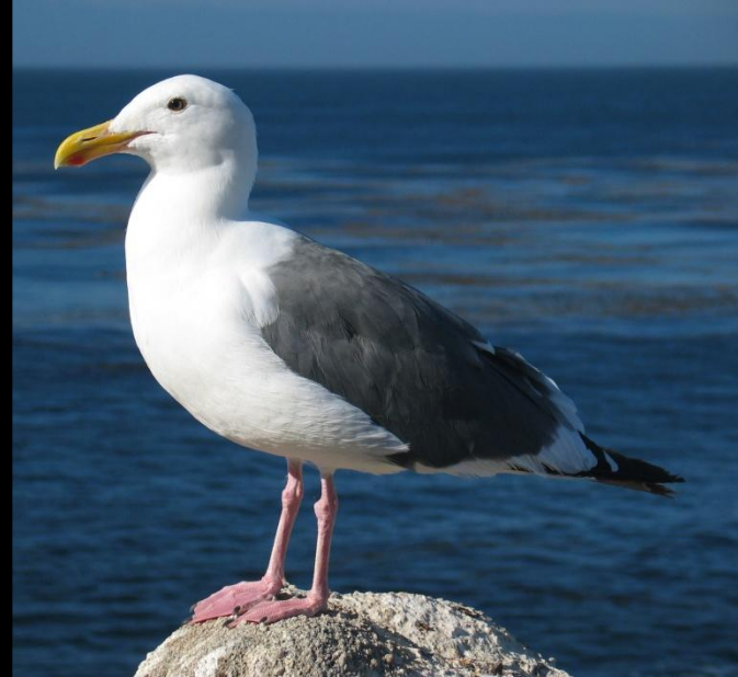
вид чайка западная

данные виды-двойники отличаются набором белков