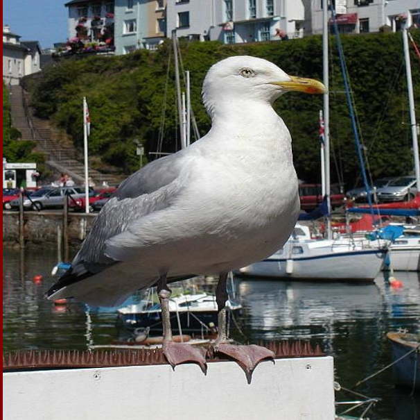
вид чайка серебристая