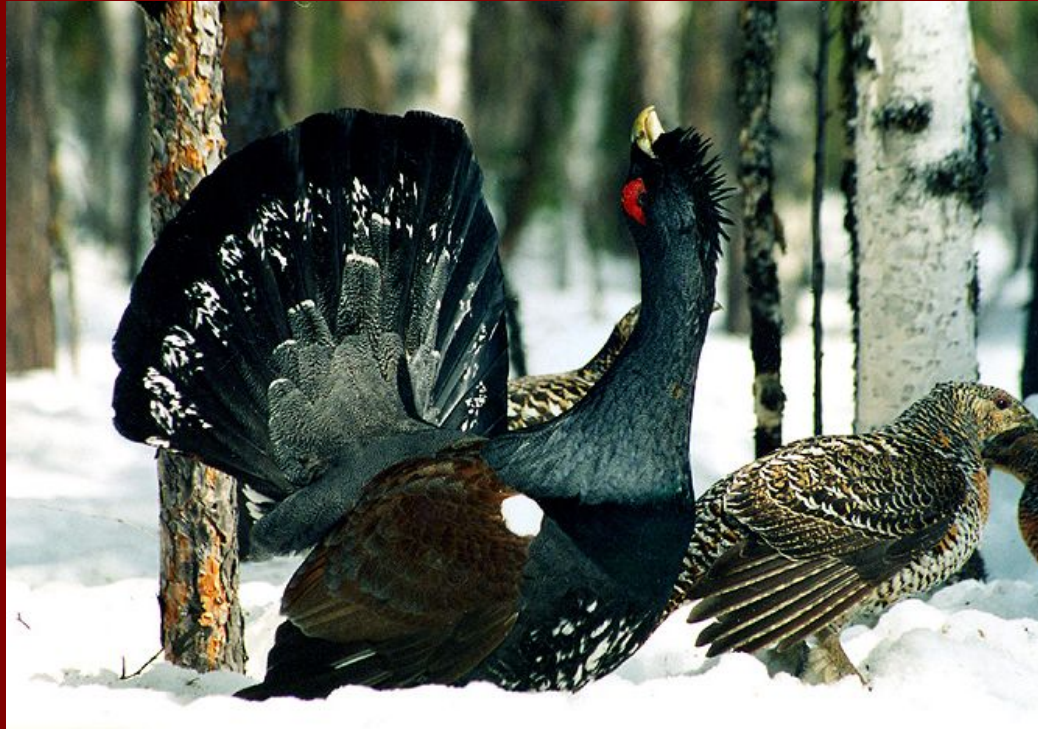
вид глухарь обыкновенный: самец и самка

2) половой диморфизм = половые различия внутри вида