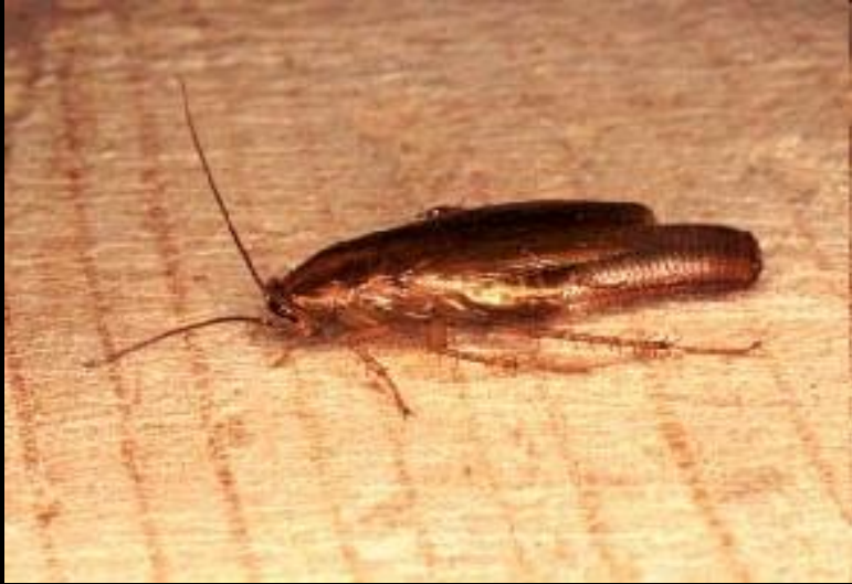
вид таракан рыжий

Географический = у каждого вида своя территория обитания - ареал