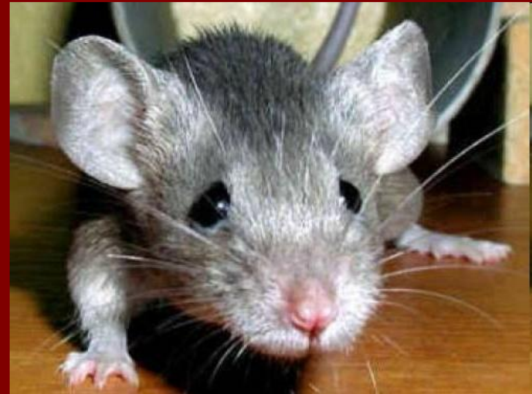
вид крыса серая

у всех млекопитающих вырабатываются сходные белки ( например, инсулин)