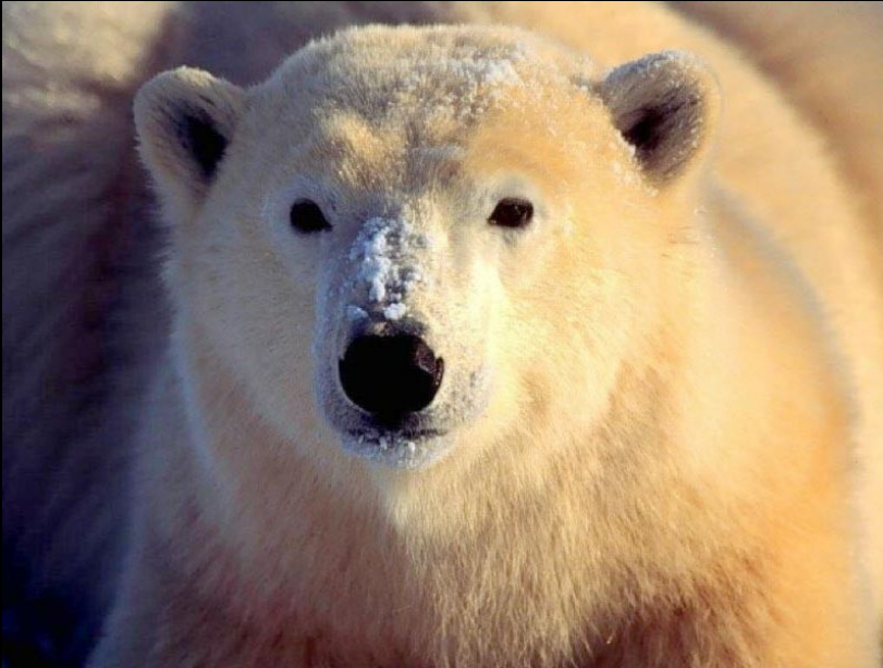
вид медведь белый (большой слой жировой клетчатки)

Анатомический = специфические особенности внутреннего строения