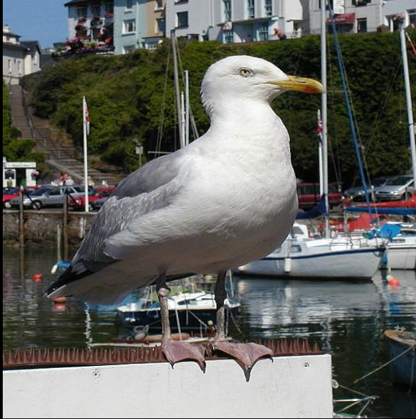
вид чайка серебристая