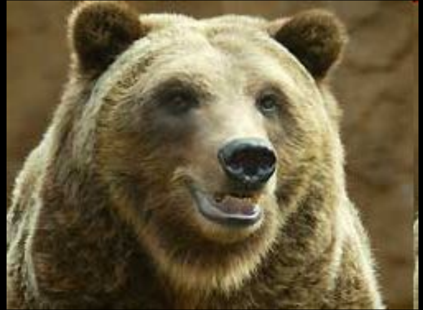
вид медведь бурый (меньший слой жировой клетчатки)