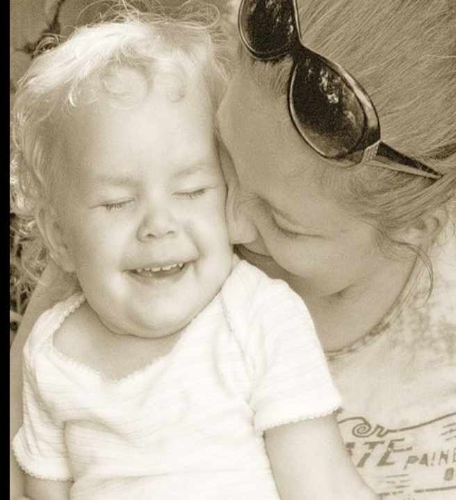
вид человек разумный