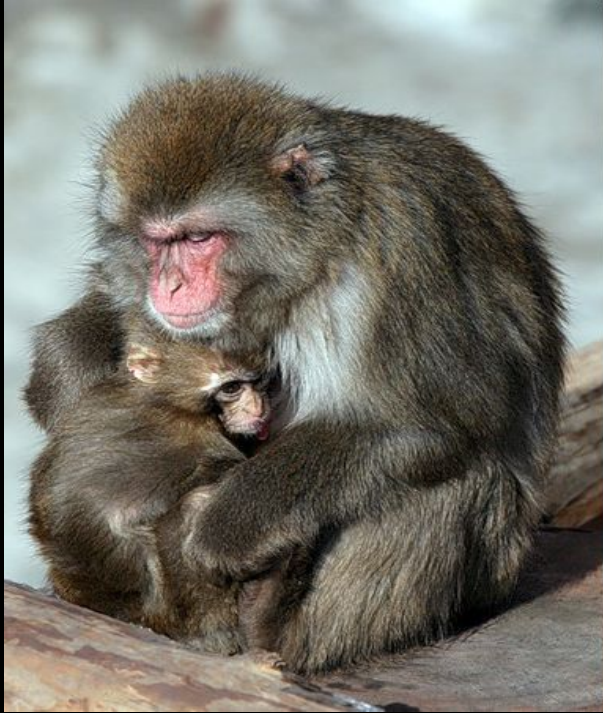
вид макака японская

Генетический = постоянство числа хромосом в клетках представителей вида