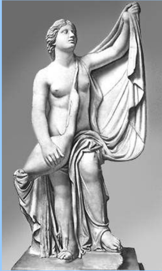
«Леда с лебедем». Римская мраморная копия с греческого оригинала скульптора Тимофея. 4 в. до н. э. Вилла Альбани. Рим.

Жена спартанского царя Тиндарея, Леда, покорила своей красотой верховного бога Зевса, который сошел к ней в образе лебедя. От этого союза Леда родила яйцо, из которого появилась Елена – получеловек, полу – лебедь. Елена отличалась чарующей красотой, за что её похитил Парис, дав повод к Троянской войне.