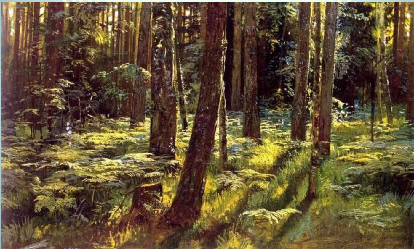
Шишкин И.И. «Папоротники в лесу»