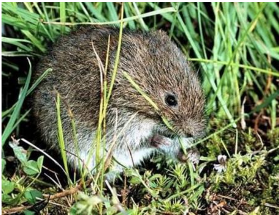
Полевка-экономка - Microtus oeconomus (Pallas

http://www.apus.ru/site.xp/049051056048124053054050052.html