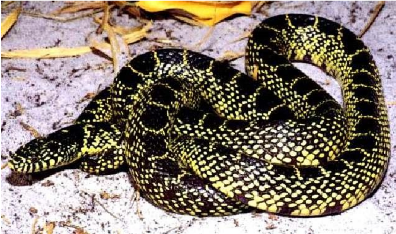
Королевская змея пустынная ( Lampropeltis getula... http://www.terrariy.ru/Anim/Snake/Desert_p.htm

Животные пустынь имеют, как правило, желто-бурую или песочно-желтую окраску.