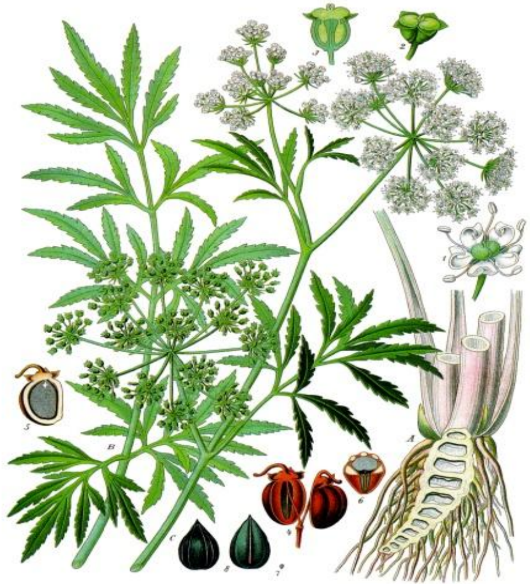
Cicuta virosa L.