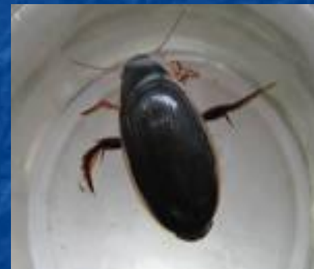
Жук - плавунец