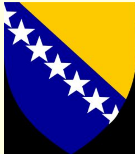
Герб Боснии и Герцеговины