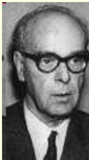
Мехмед Меша Селимович