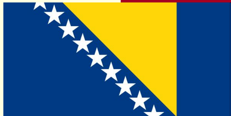
Флаг Боснии и Герцеговины