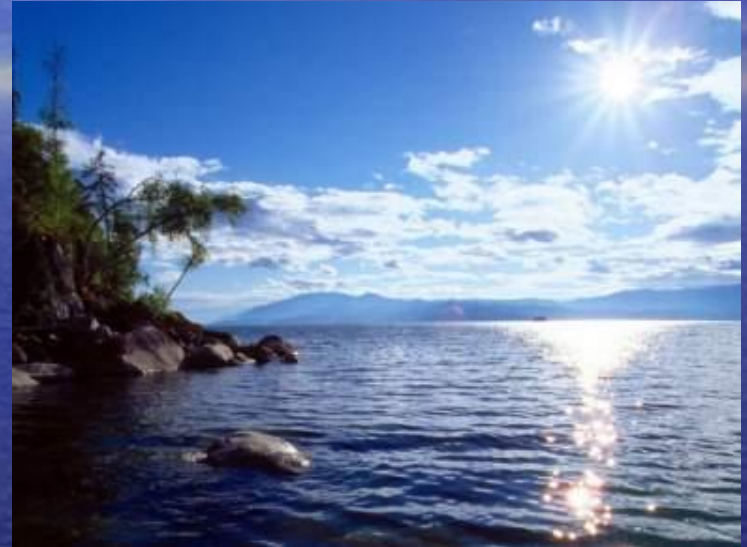
Исток реки Волга