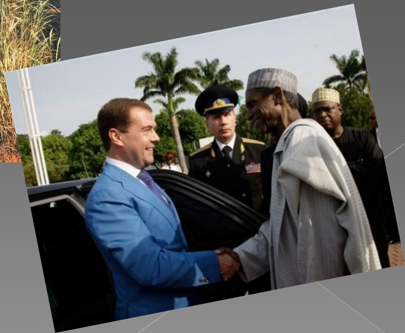
Нигерия, г. Локоджа, октябрь 1993г.