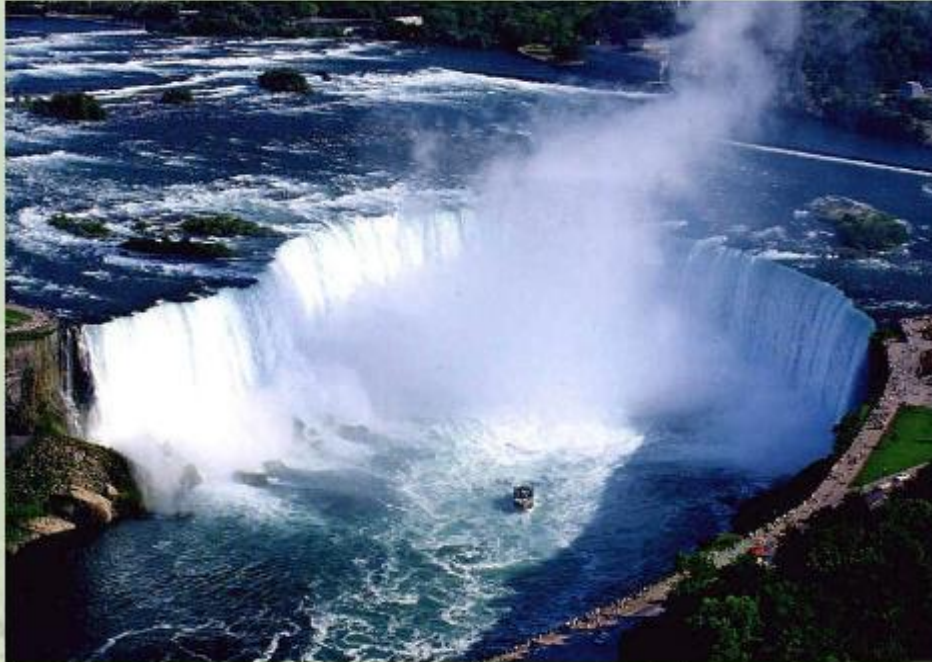
Ниагарский водопад в Северной Америке.