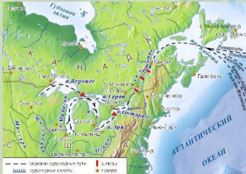
Картосхема водного пути (Великие озёра и река Святого Лаврентия).

Великие озёра - крупнейшая пресноводная система в мире. Однако несмотря на большие размеры, эти озёра принимают довольно мало рек.