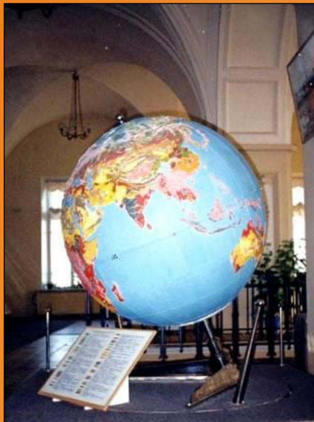
Почвенный рельефный глобус в Центральном музее почвоведения им. В.В.Докучаева в Санкт-Петербурге

Почва считается зеркалом ландшафта потому, что каждая почва со своим набором почвенных горизонтов соответствует определенным условиям образования, и формирование каждого почвенного горизонта, и собственно почвы, происходит в конкретных местных условиях, при определенном климате, под определенной растительностью.