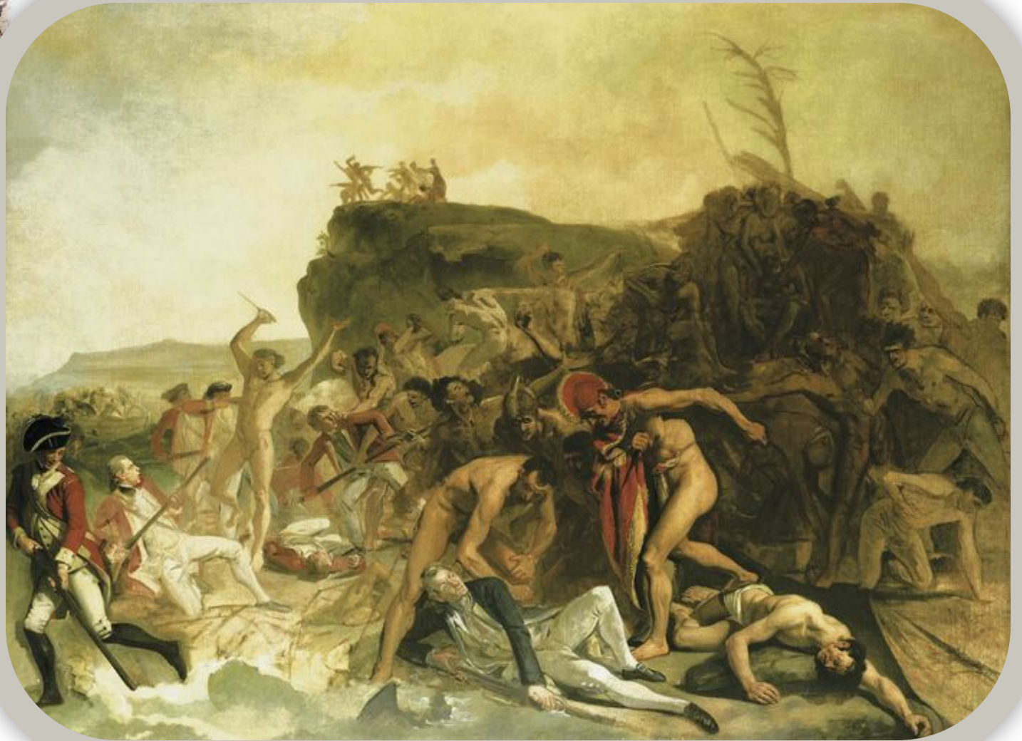
«Гибель капитана Кука»