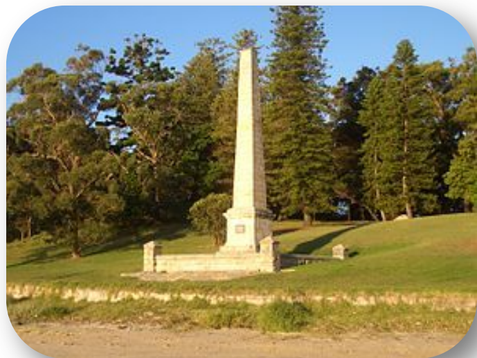
Обелиск, посвящённый Джеймсу Куку в Карнеле (пригород Сиднея)