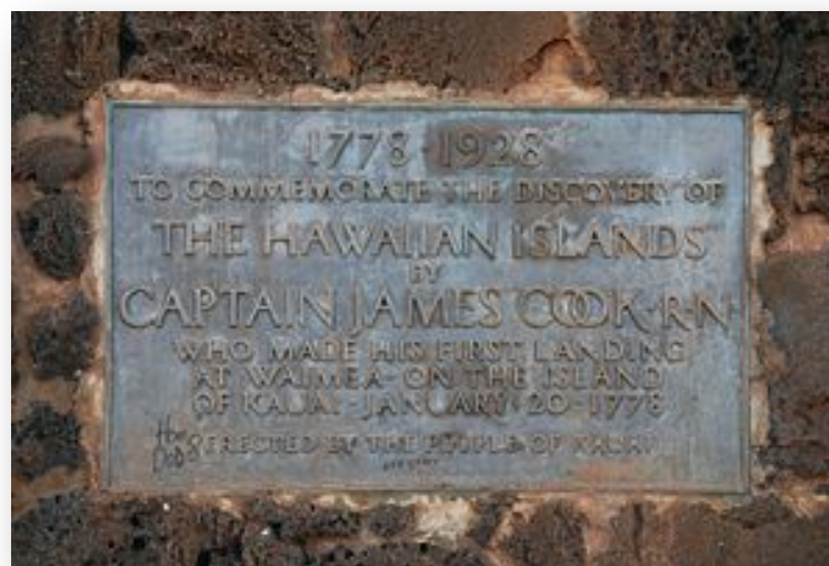
Надпись на обратной стороне мемориала капитана Джеймса Кука, Ваимиа, о. Кауаи (Гавайские о-ва)