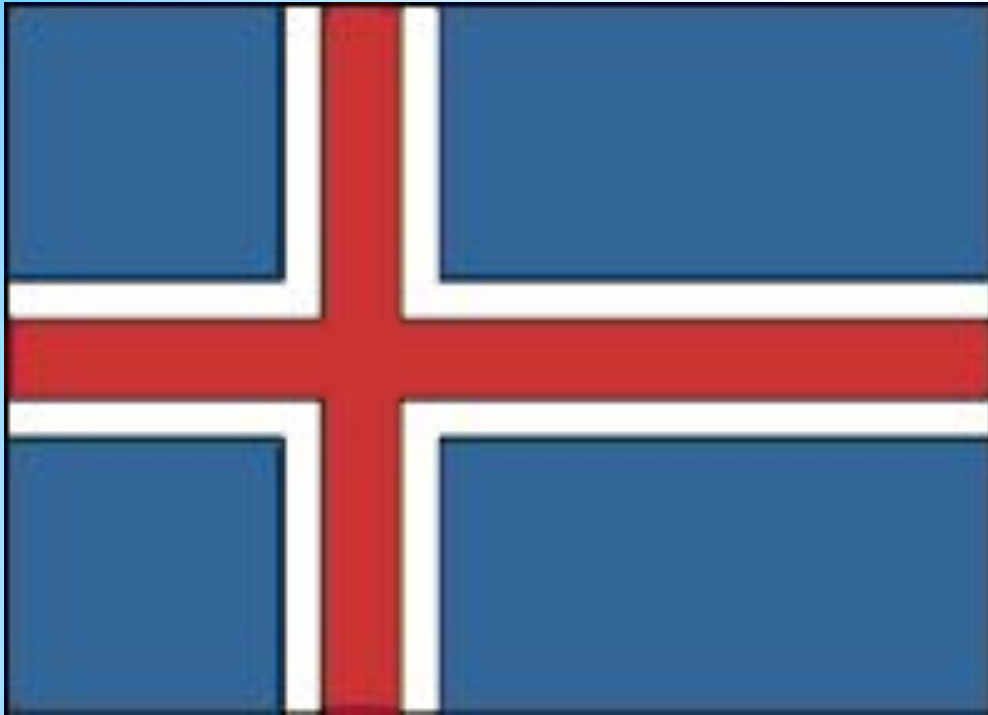
* Флаг Исландии