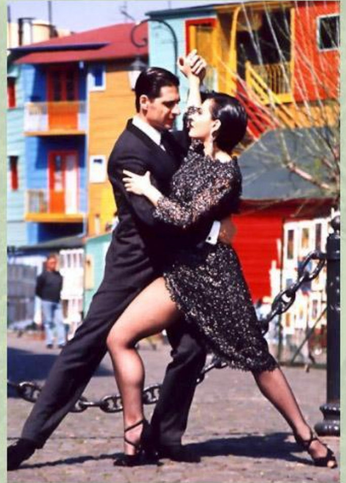
В ритме аргентинского танго.