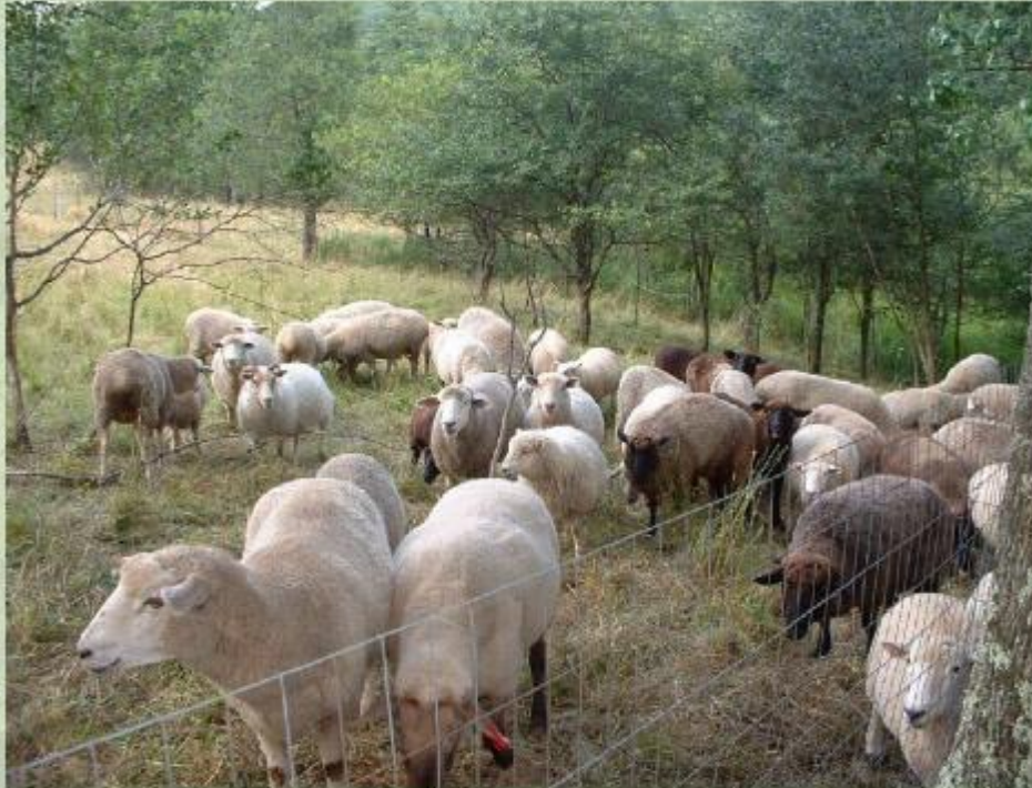
Сельское хозяйство в Уругвае.

Гран-Чако - район разнообразного сельскохозяйственного производства. На севере, у границы с Парагваем, находятся плантации хлопчатника. В полосе между реками Парана и Уругвай расположены животноводческие ранчо, плантации цитрусовых и риса. На северо-востоке, в провинции Мисьонес, выращиваются чай мате, рис и фрукты. На севере Парагвая на травянистых равнинах Гран-Чако проживают индейцы мака и гуарани.