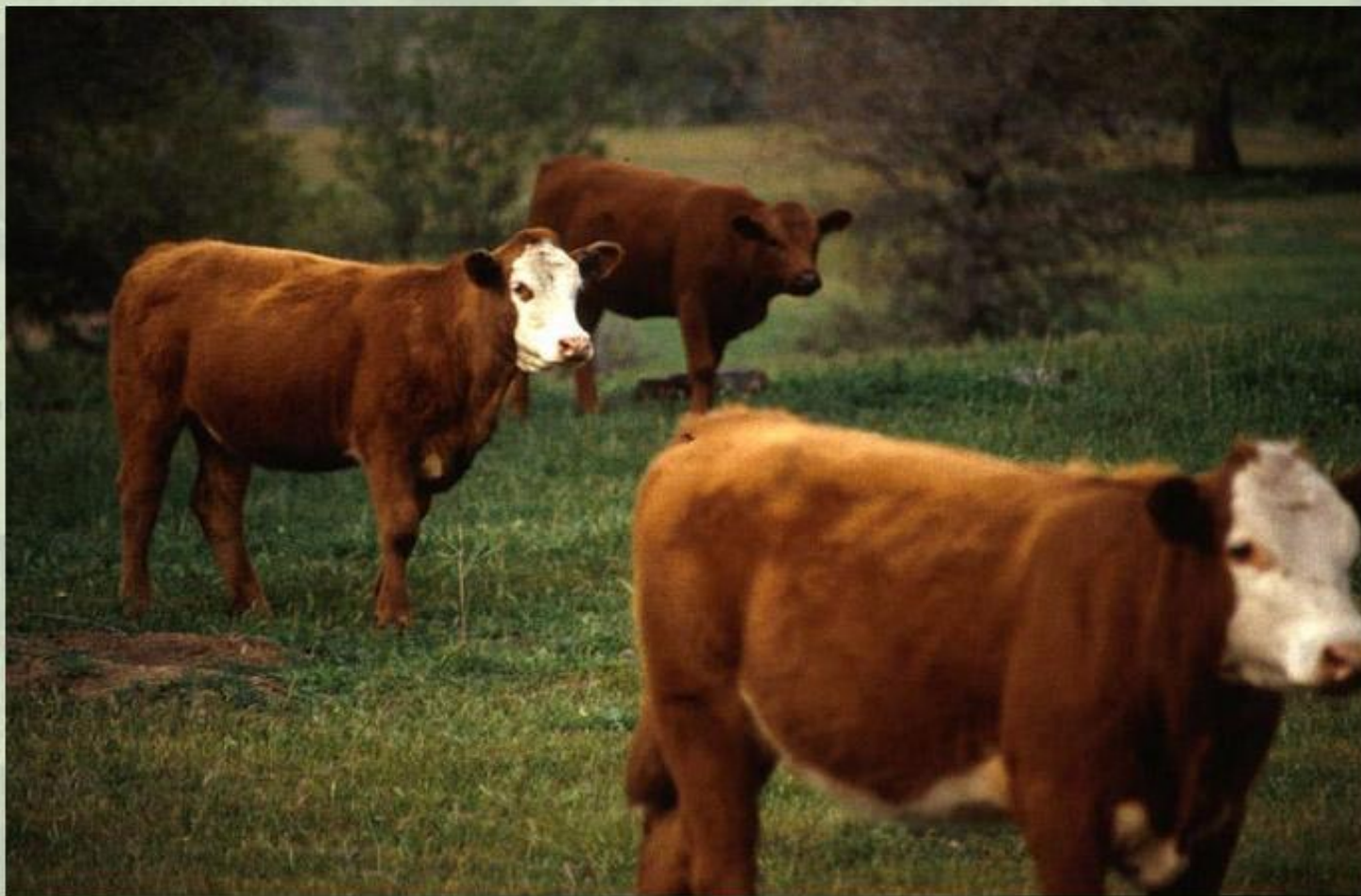
Скотоводство в Аргентине.