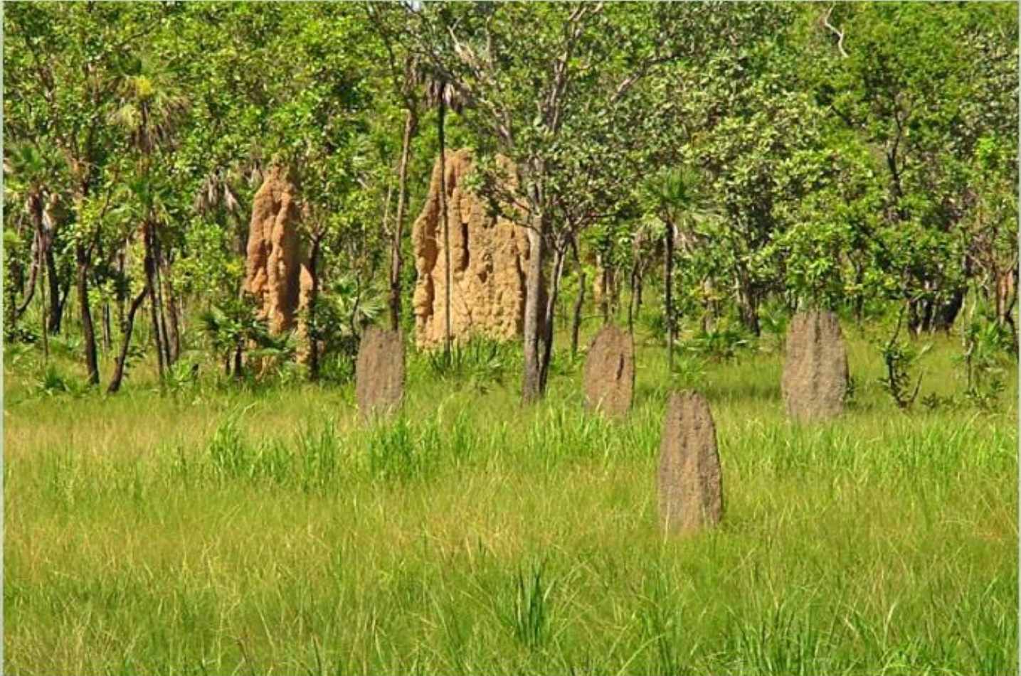
Термитники в пампе.