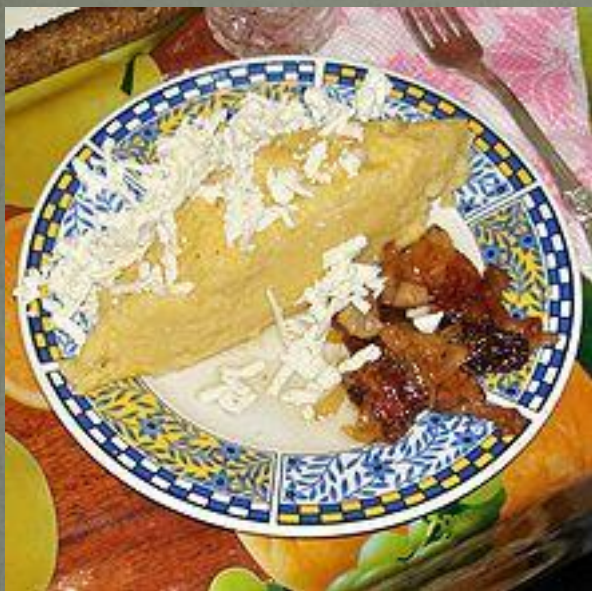
Мамалыга с брынзой и шкварками

Молда́вская кúхня — национальная кухня Молдавии. Молдавия расположена в регионе богатых природных возможностей, винограда, фруктов и разнообразных овощей, а также овцеводства и птицеводства, что обуславливает богатство и разнообразие национальной кухни.