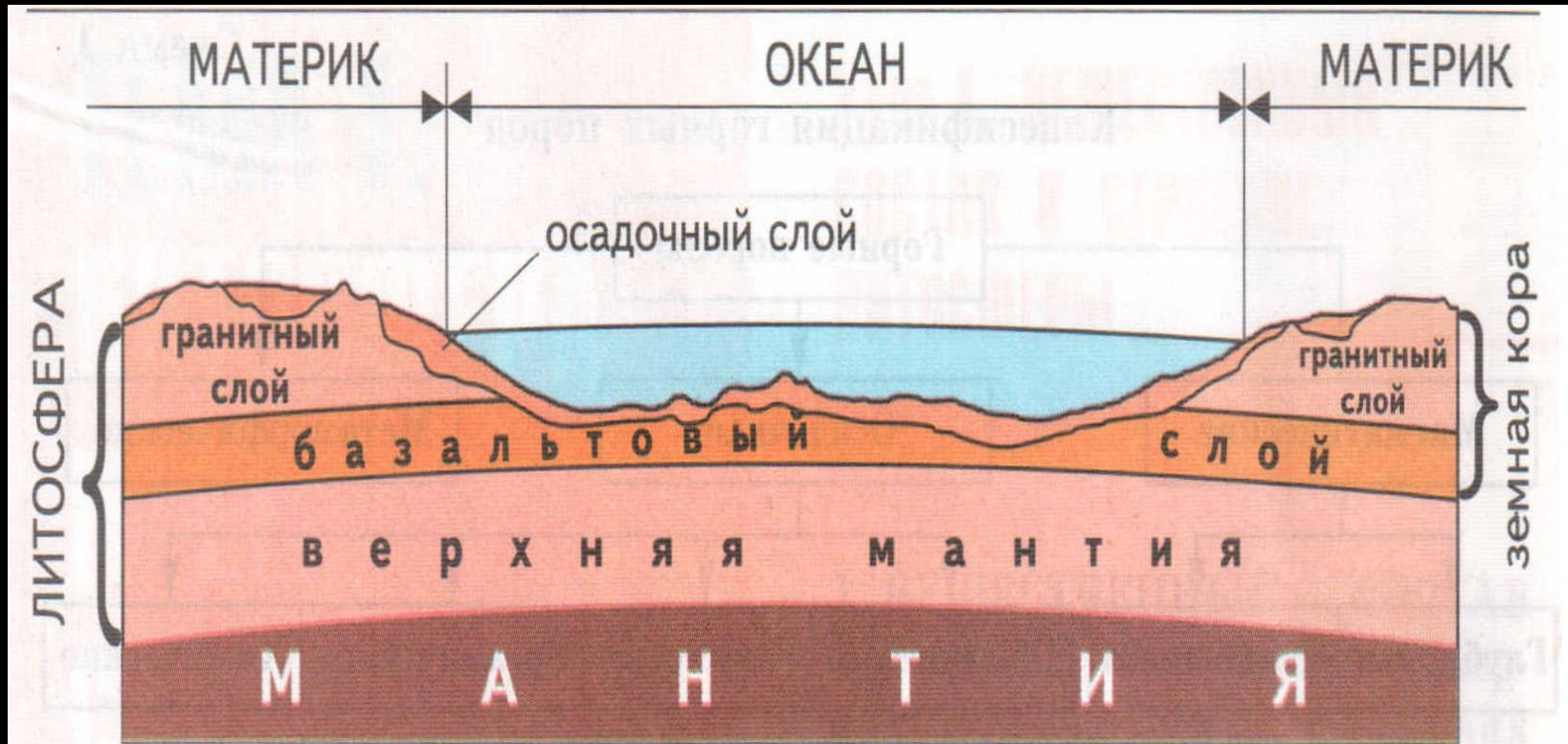
Рис. 1. Строение земной коры