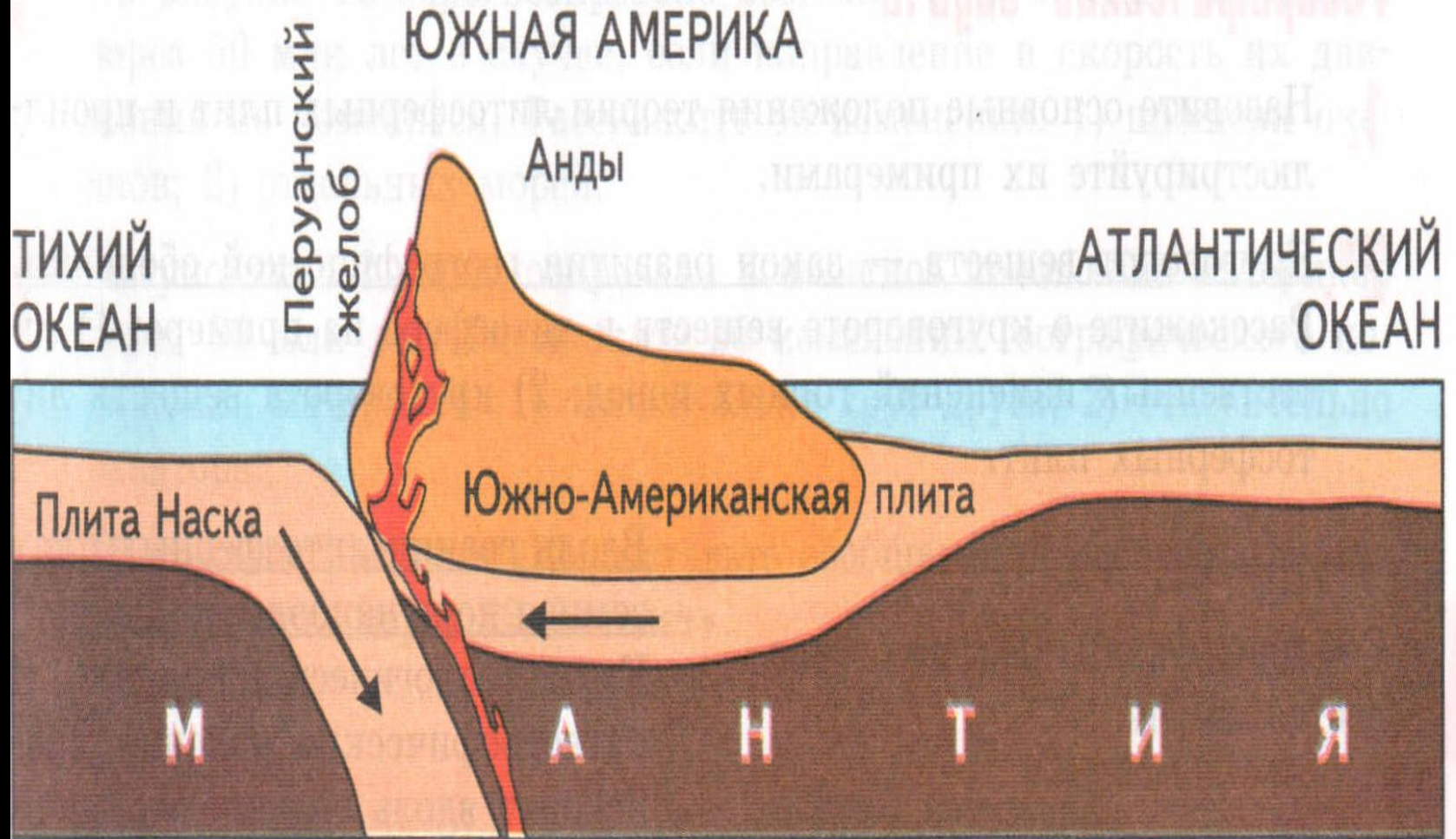
Рис. 11. Столкновение материковой и океанической литосферных плит