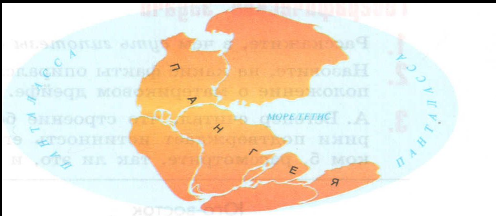
Рис. 2. Поверхность Земли 200 млн лет назад. Названия Пангея и Панталасса происходят от греческих рап — «вся», ge — «земля», talassa — «море». Название Тетис — от имени греческой богини моря Thetis