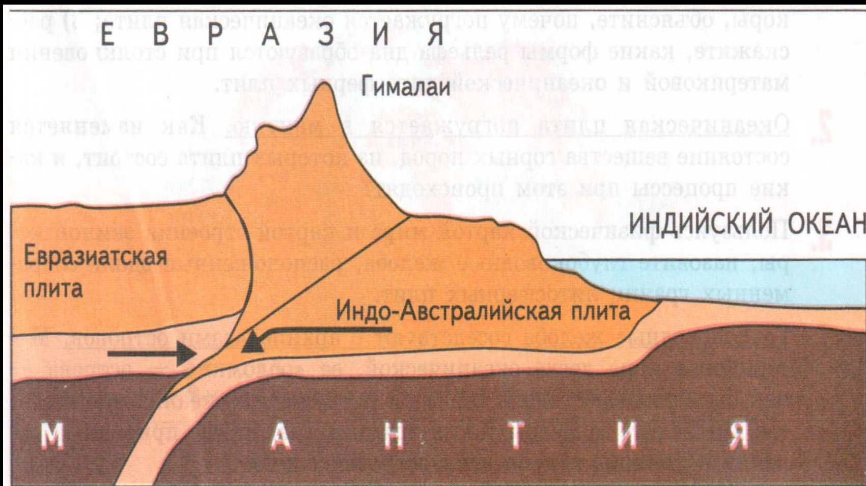
Рис. 10. Столкновение материковых литосферных плит