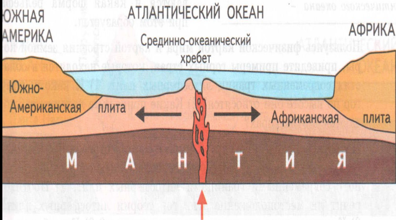
Рис. 8. Расхождение литосферных плит в зоне срединно-океанического хребта