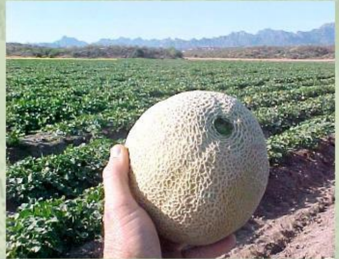
Земледелие в Средней Азии.

Население Центральной Азии занимается в основном кочевым скотоводством. В пустынях разводят верблюдов и овец, в степях Монголии занимаются коневодством, в горах выращивают коз и яков. Лишь в долинах рек и оазисах развито земледелие - там выращивают зерновые и бахчевые культуры, хлопчатник.