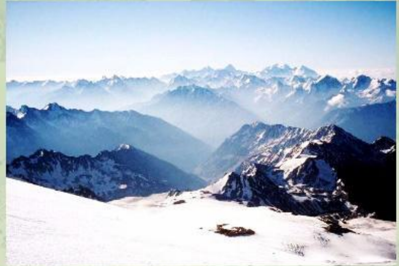
Горы Средней Азии.

Горы региона отличаются большой высотой и суровым климатом. Равнинные участки Центральной Азии заняты в основном пустынями и полупустынями. Столь сложные природные условия наложили отпечаток и на население региона.