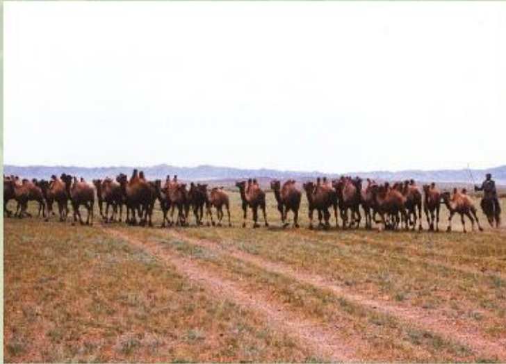
Скотоводство в Монголии.